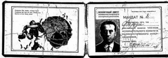
Şefik Hüsni’nün KEYK üyesi kimliği, 22 Eylül 1928 [RGASPI fond 495, op. 266, d. 38]

1928’de Komünist Enternasyonal VI. Dünya Kongresi’nde, Şefik Hüsni, yokluğunda, Yürütme Kurulu üyeliğine seçilmiştir.