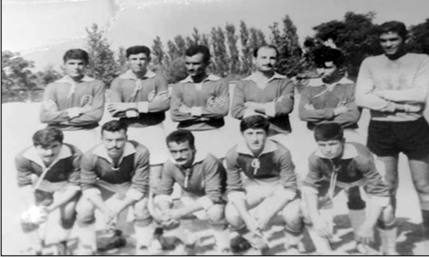
Hasköy futbol takımı