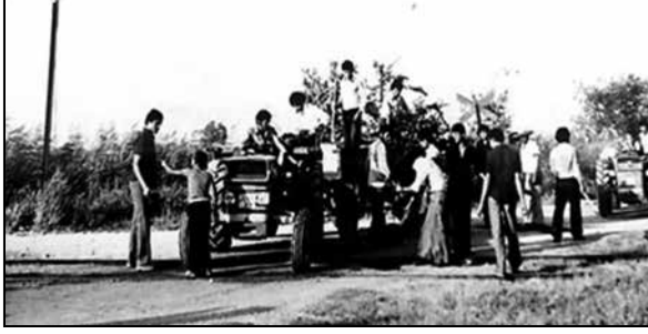
Köy yolu asfaltlama çalışması...

Bir başka kararımız, tiyatro oyunu sergilemekti. Cevat Fehmi Başkut'un "Buzlar Çözülmeden" oyununu sahneleyeceğiz. Oyunda bir tek kadın rolü vardı. İlkokul öğretmeni arkadaş, rolü önce kabul edip sonra vazgeçti. Yeri ne bir erkek arkadaşımız o rolü üstlensin istedik, çapa tarlalarında oyundaki rol adı olan Hatice ile anılırım diye, kimse kabul etmedi. Haklıydılar da... Uzun süre, oyundaki rol adım Avukat Şeref Hakarar ile anılmıştım köyde. Piyesteki o kısım anlatıyla geçiştirildi. Kaymakam rolündeki arkadaşımız, kendini rolüne öyle kaptırmıştı ki ağa rolündeki arkadaşımıza gerçekten tokadı patlatmış, tokatlanan arkadaşımız, profesyonellere taş çıkartırcasına rolünün hakkını vermişti. Köylü bizleri ilgi ile izlemiş dakikalarca alkışlamıştı. Alt yapı kurulmuştu. Daha sonraki yıllarda gençlerimiz "Aladağlı Muho"yu sergilemişlerdi. Köyün futbol takımı, "köyler arası futbol karşılaşmalarında Sarayköy Kaymakamlık Kupası"nı kazanmıştı.