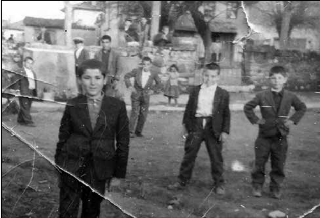
Cami avlusunda, 8-10 yaşları

Her yer oyun alanımızdı. Kızlı, erkekli oyunlarımızı paylaşırdık. Bezlerden yaptığımız toparla oynadığımız futbol maçlarında beni oyuncu hakem yaparlardı. Yüzmeyi 8-10 yaşlarında abilerimin, Menderes Nehri’ne atması sonucu, can korkusuyla, akıntıyla boğuşarak öğrenmişim.