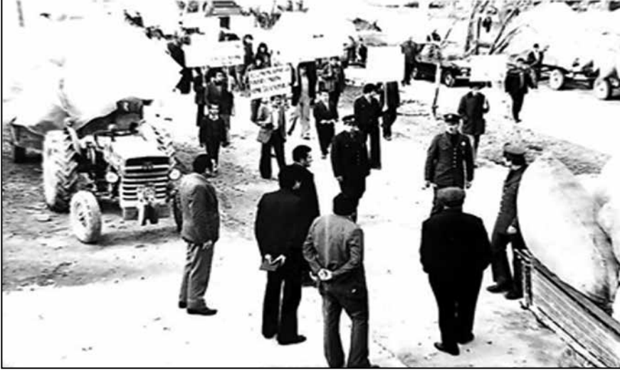
Sarayköy Pamuk Mitingi

Köylünün ekonomik sorunlarıyla ilgilenmeliydik. Sarayköy tarihinde belki de bir ilkti. Pamuk üreticilerinin sorunlarını içeren bir miting tertitledik. Köyler arası yaptığımız futbol maçlarıyla tanışıp dostluğumuzu geliştirdiğimiz çevre köylerden pamuk yüklü traktör römorklarıyla bu eyleme katıldılar.