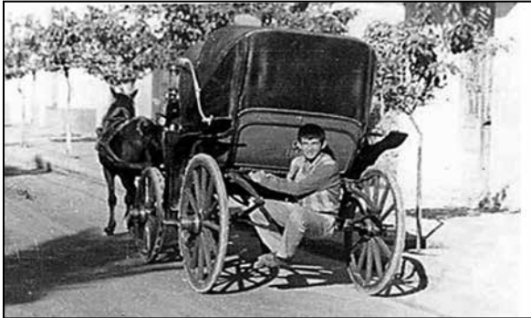
Kaçak fayton yolcusu.

Ortaokula üç buçuk kilometrelik yolu yaya gidip geldiğimiz Sarayköy’de başladım. Aydın bir köydü benim köyüm... Kız-erkek, ortaokula giden çok öğrenci vardı. Sırtımızda çantalar, elimizde sefer taslarıyla gidip geldik okula. Sarayköy’ün faytonları ünlüdür. Yolda rastladığımız faytonların arka aksına oturup gitme çabamız, sürücünün arkaya kadar ulaşan kamçısıyla karşılandığında yaya olarak yolumuza devam ederdik.