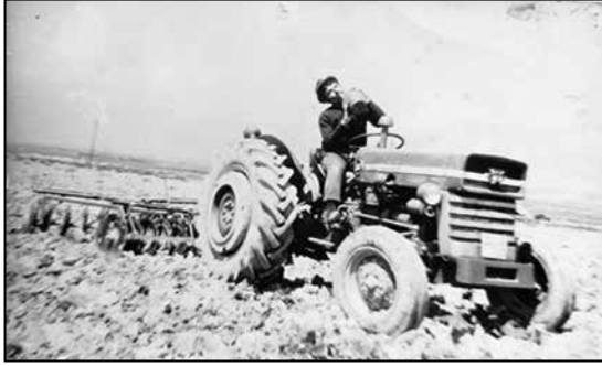
İşte o tarla...

Çocukluğumuzu en iyi şekilde özgürce yaşıyorduk, her şey çok iyiydi. Ama giderek büyüyen bir sıkıntı içimi kemiriyordu. Babam bana ekime hazırlanması için tarlanın sazlarını, yaban otlarını temizleme görevi vermiş, ben kaytarmıştım. Gerekeçlerim de vardı hani... Tarla çok büyüktü, işin boyutu beni aşıyordu, içine girdiğimde sazların içinde kayboluyordum âdeta. Yılan, böcü börtü korkusu sarmıştı içimi. Tarlanın ekim zamanı yaklaştıkça geliyorum diyen dayak yeme korkusunun tedirginliği, oyunlarımın içine limon sıkılmış, neşem kaçmıştı. Babam, tarlanın otlu durumunu görmüş, eve gelir gelmez eline sopayı almıştı. Neyse ki sopadan ananın kaç uyarısıyla kurtulmuş, babamın siniri geçince sözleşmesiz barış imzalamıştık.