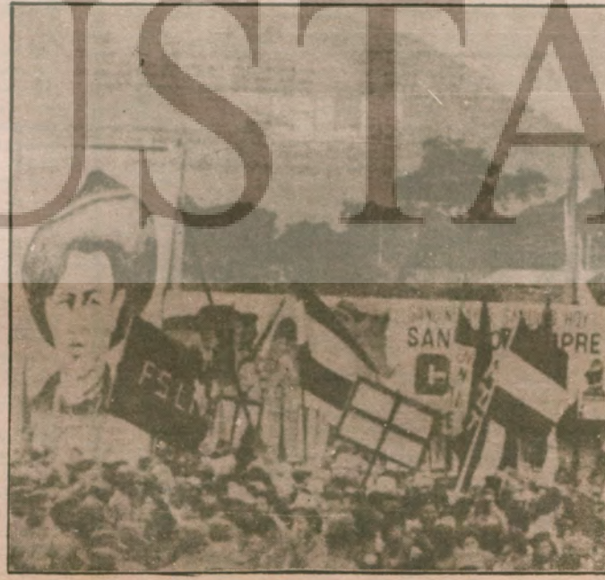
●Managua'da 19 Temmuz'da dağlara SÜKC'nin adı kazandı.