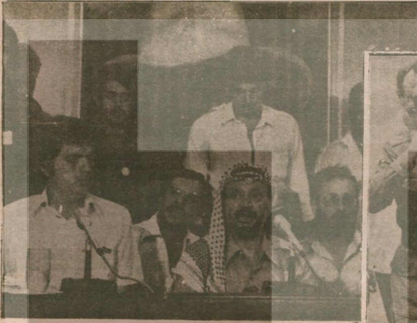
●19 Temmuz Sandinista Halk Kurtuluş Cephesinin öncülüğünde Nikaragua halkının CIA destekli Somoza kanlı diktatörlüğünü devirdiği gündür. Tüm dünya halklarının Nikaragua halkının sevincini paylaştığı bu günde, baskent Managua'da yarım milyon kişinin katıldığı törene Nikaragua devriminin liderleri yanısıra Fidel Castro, Yasser Arafat ve çeşitli ülkelerden gelen temsilciler katıldı.

●Ülkenin yeniden kurulmasına omuz vermek amacıyla tarlalarda, plantasyonlarda, yol yapımında gönüllü çalışma birlikleri oluşturuldu.