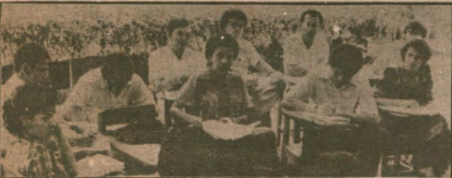
●Cehaletle mücadele seferberliğinin bir parçası olarak Alfabe öğretmek için kurulan kültür merkezlerinde 200.000 kadar öğrenci ve öğretmen yetiştiriliyor.