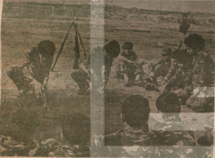
• Filistin halkı İsrail yayılmacılığına karşı kadınından, erkeğine hatta çocuğuna kadar topyekün kararlilikla savaşıyor.

çölüne' karşı oldukları açıkla makla sınırladı; Arap kurtuluş hareketlerine yönelik en önemli tehditlerden biri olan ülkemizdeki ABD ve NATO üsleri konusunda net tavır koymaktan kaçındı. Afganistan halk devrimine karşı sürdürülen emperyalist-gerici kampanyanın başını çekti. Erbakan'ın şimdiki tavrı daha önceki uygulamalarıyla çelişiyor. MSP lideri, bu olayda da ülkemizdeki dinsel duyguları güçlü olan, aynı zamanda Müslüman halkların bölgemizde emperyalizme karşı verdikleri savaşımdan etkilenen kesimlerin özellikle MSP'nin tabanının duyularını sömürüyor; Arap ülkeleri içindeki gerici rejimlerle iyi ilişkilerini geliştirmeji hesaplıyor.