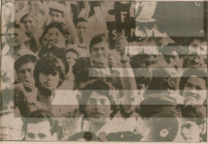
●Devrimin yıldönümü toplantısında 19 Temmuz alanında 500.000 Nikaragua'lı her günün 19 Temmuz olacağına and içti. Amerikan emperyalizminin Karaipler ve Orta Amerika'da sürdürdüğü saldırgan politikaya karşı Nikaragua halkının bölge halklarıyla birlikte olduğu ve dünya halklarının onlarla dayanışma içinde oldukları haykırıldı.