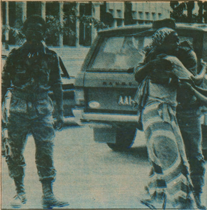
1976'da MPLA, karşı devrimcilerden geri aldığı bir kentte sevinçle karşılanıyor.

Ancak, Moskova'da Olimpiyat Meşalesi yandırdığı sürece tüm barışsever insanlık uluslararası kardeşlik ve dostluğun coşkusunu bir kez daha yaşayacak. Dünya barışseverleri, ülkemizdeki barış ve demokrasi güçleri Moskova 80'in barış ve dostluk ateşinin dünya barış hareketini güçlendireceğine, soğuk savaş kıskırtıcılarına, emperyalizmin saldırgan politikasına karşı daha geniş yığınları bir araya getireceğine inanıyorlar.