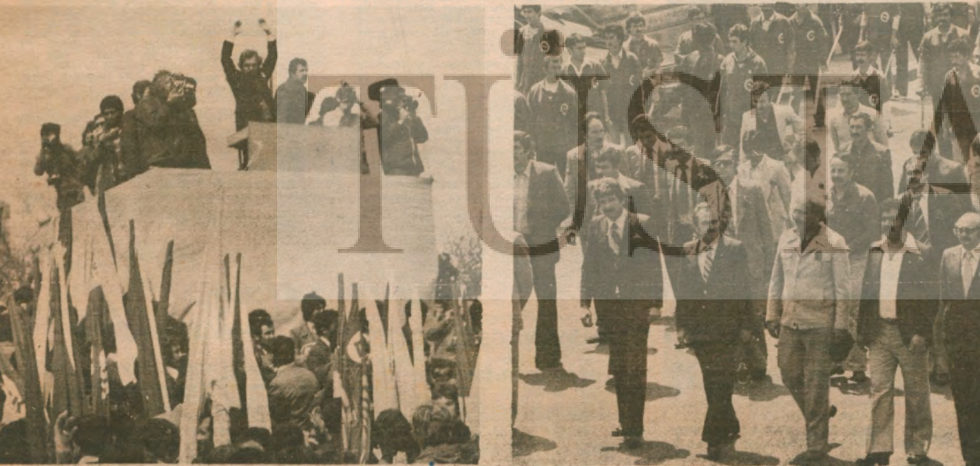
DİSK GENEL BAŞKANI KEMAL TÜRKLER 1 MAYIS'LARDA..

Demokrasi güçlerinin bu kararlılığına karşın, Türk-İş başları yaptıkları toplantıdan sonra tekeli sermaye ve onun çağrılarını doğrultusunda bir açıklama yaptılar. Denizci, "Milli birlik çağrılarında hala iki partinin lideri kulak tıkamaya devam edecek mi?" dedi. Ancak, Türk-İş başlarının bu tutumu tabanı tarafından onaylanmadı ve daha ilk günden Maden-İş'le birlikte kimi yerlerde Türk-İş üyesi işçiler işi durdurdular.