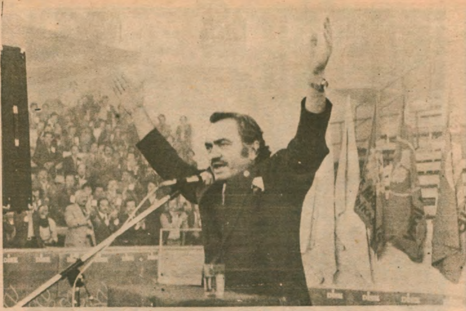
TÜRKLER DİSK TEMSİLCİLER MECLİSİ'NDE

VE TÜRKİYE İŞÇİ SINIFI 23 TEMMUZ ÇARŞAMBA GÜNKÜ GENEL GREVE HAZIRDI!..