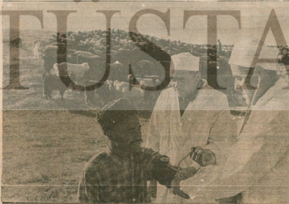
Tacikistan Vakf bölgesinde halk olağan sağık kontrolünden geçiyor.

İşte kapitalist ülkelerdeki işçiler, Türkiye'deki işçiler sosyalist ülkelerde yaşam biçimi haline gelmiş emel hakları işverenlere dayatmak, söke söke, açlığa ve baskıya karşı dövüşerek almaya çalışıyorlar. Demokratik hakçı kazanımlar uğrunda en kararlı savaşımı da sınıf ve kitle sendikacılığı ilkesini temel alan sendikalar veriyor. Sönmezsoy'un öfkesi boşuna değil!