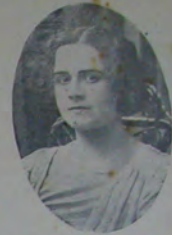
الطبري مركز دارالدين تفكيكياتي حديدہ تفكيقاتہ بولتی اور یہ انیوم شہزادہ بونان (مادھن مارگن) بولھان پناہ سے محروم ہوجاؤں تیدہ سطرطری بڑمندر . فرانسہ (Clare) جمعہ سندہ قادن اچھتہ دائر بازی و (قادن و سن) استمدک قنیں اسلوب ودرن فکر ایکی رومیائے مشہور اولان سترطریک روسیہ الہ بر روسیہ قارتر بر عرس ابدگ کہنسی سالارز .