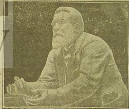
[ ] بولیش ( روهی ) و قلمردن ایتقدر .

فرانسه پروله ناریسی ؛ حرب عمومی اعلان کونی ، بالخاسه صرحم ملتبی غرته لرنک تصونتی اکیز تقریبات تحت تأثیرنده شومر سز بر سر بری طرفندیک ناسجه سته یارنده قتل ایدیان ژان ژوروسک وفاتک سکرینس سه دوریه سته معادلی کونده بویوک سوسیالیست و آنتین خلیب ایچون عمومی نظر اهرزده بولوتلورده . ژوروس ، پالکز فرانسه ده دکمال پوتون عملکلرده ، حق وعدالتک مدانی ، شیعقلرک حاجتی بالخاسه بویوک برخطیب اولراق طامعش محترم بر شخصیتدر . فقط ژوروسک سوسیالیزم عالنده کی وضعیق وینتیل ایتدیکی قایل عقنده بک آریکسه مک ملاماتی وارد . ژوروسک حاجتی قیسه جه آکلندنم سوزکا بو خصوصه بر آرز معلومات ویرمچکز . ژوروس : فرانسه ک ( سالون ) شیرنده ، ( ۱۸۵۹ ) ده دوتیابه کشفرد . مختلف شهرلرده کی مارغلتورده ، فلسفه عملکلرنده ، بولوندرندن سوزکا امپونانه کیدر . بدولخاسه ( ماولون ) اثرلرنیک مطامعه سی اونی سوسیالیزم سوق ایتقدر . بر جوق غرته وجموعه لره عورک ایتدیکن سوزکا ، ( revne socialiste ) ی چیقارش و دهاا سوزکا ، بون لالان فرانسیز قومیوتیت پارتنسک واسطه نشر انگاری اولان ( Humanité - انسانیت ) غرته سی تأسس ایتقدر .