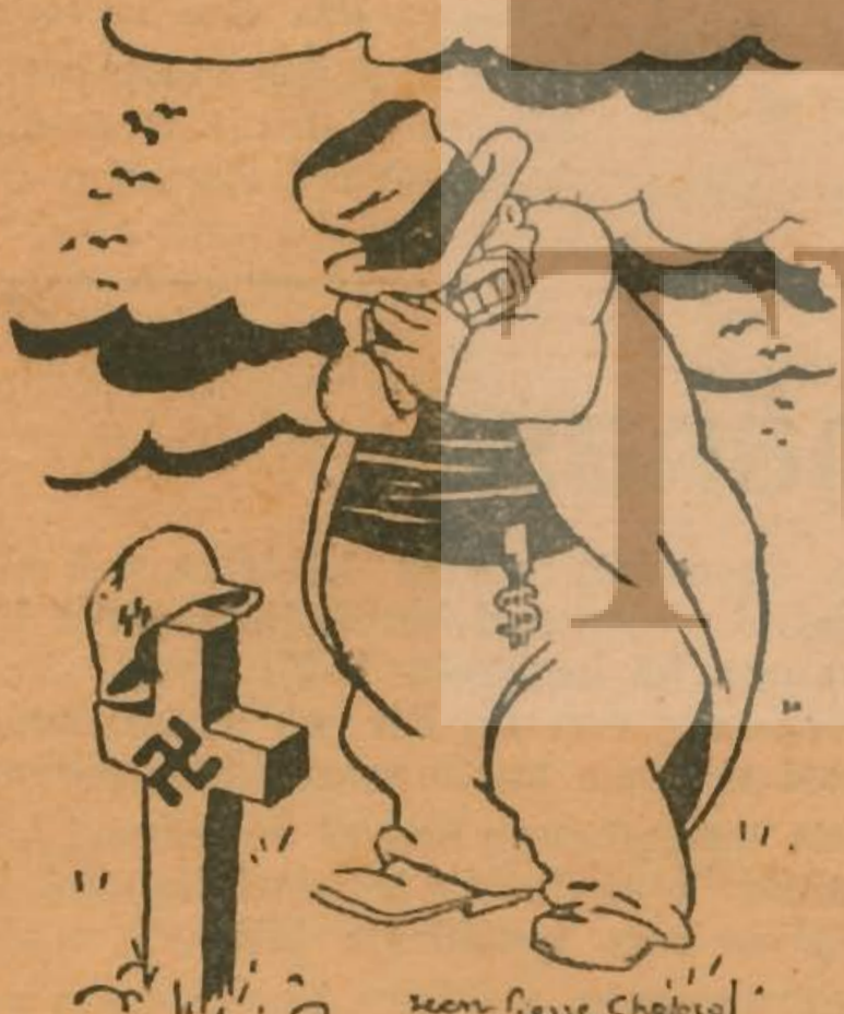
« Pardon !... » (d'après H. Daumier)