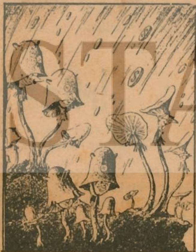
Bereketli Marsal yağmurları