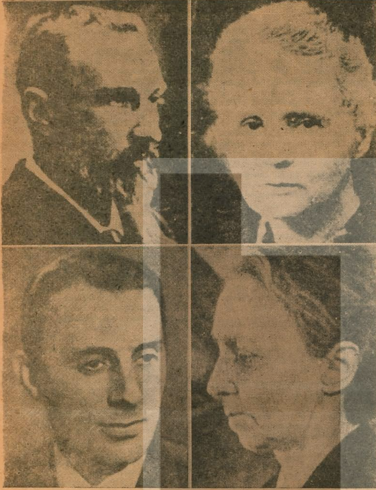
Yukarıda: Pierre ve Marie Curie. Aşağıda: Frédéric ve Irene Joliot-Curie

«Aşağıdaki yazı Joliot Curie'nin Fransız hükümeti tarafından, Fransız atom enerjisi komisyonu başkanlığından çıkarıldıktan sonra söylediği bir nutuktan kısaltılarak alınmıştır.»