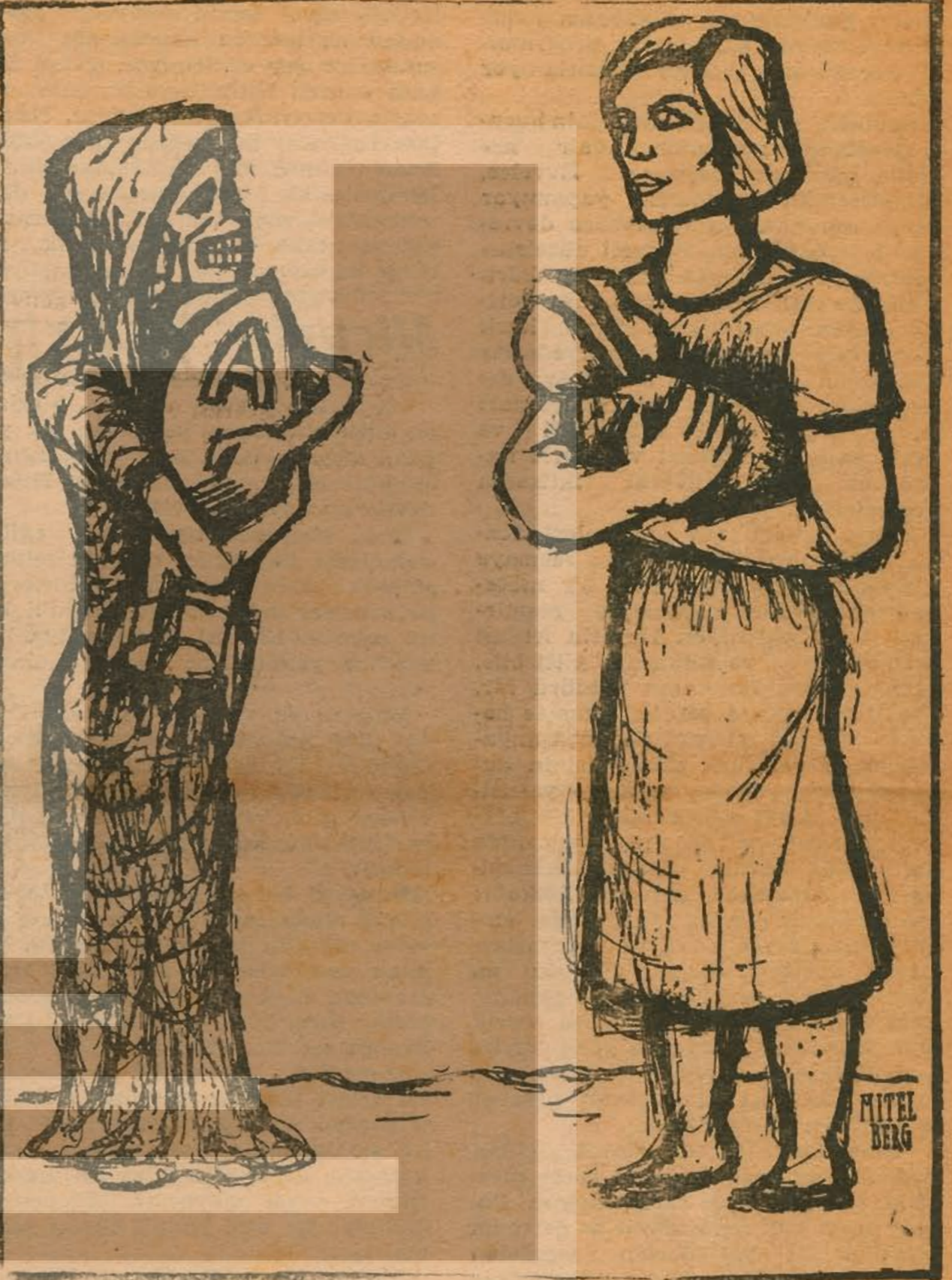
— İkimizden biri lüzumsuzdur