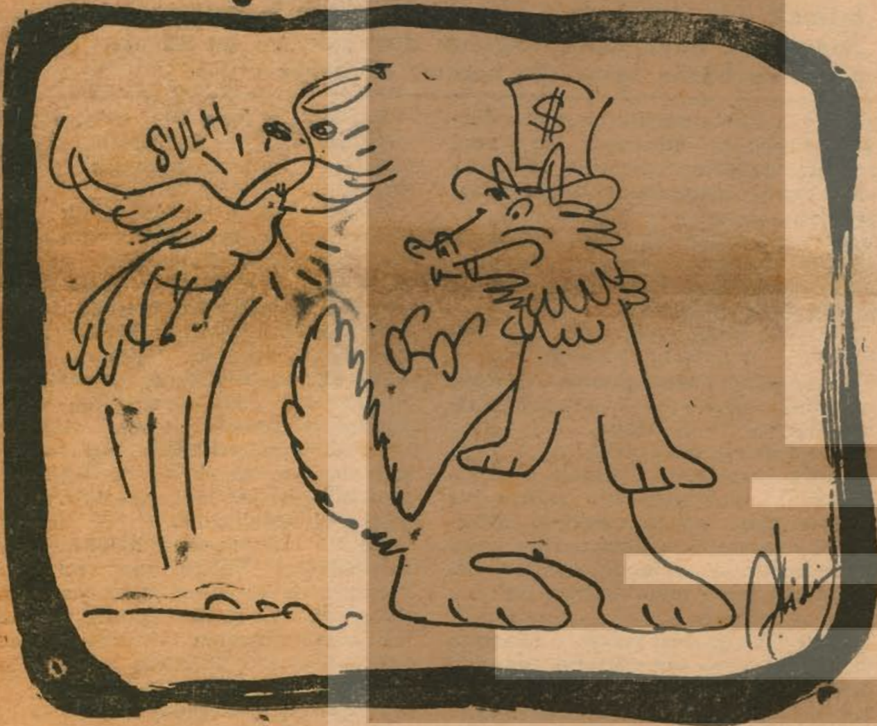
Bir tilkinin güversine göz diktiğidir

Eğitim üyeleri üzerinde bir baskı yapmak gayesini güden Mundt-Nixon kanun tasarısı karşısında Los Angeles şehri kolejleri öğretmenleri ile birlikte toplantılar yaparak bütün iyi niyetli insanlardan Amerikayı bir polis devleti olmaktan kurtarmaları için bütün kuvvetleriyle çalışmalarını istemiştir.