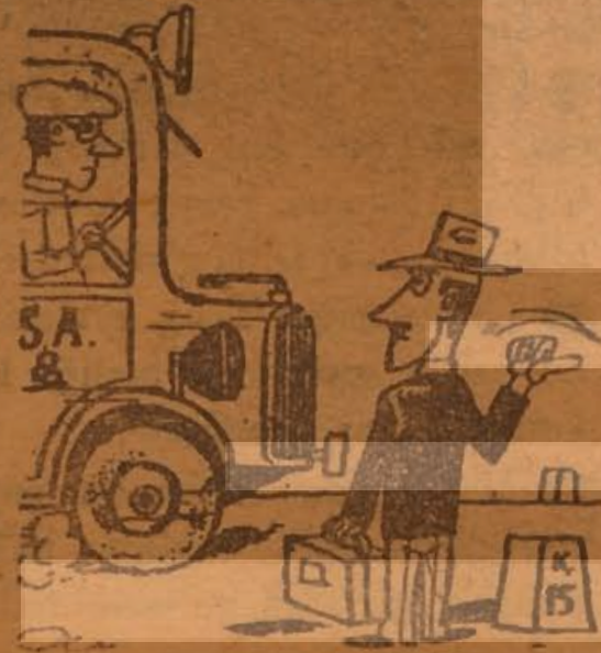
— Otomobilinize almırsınız.