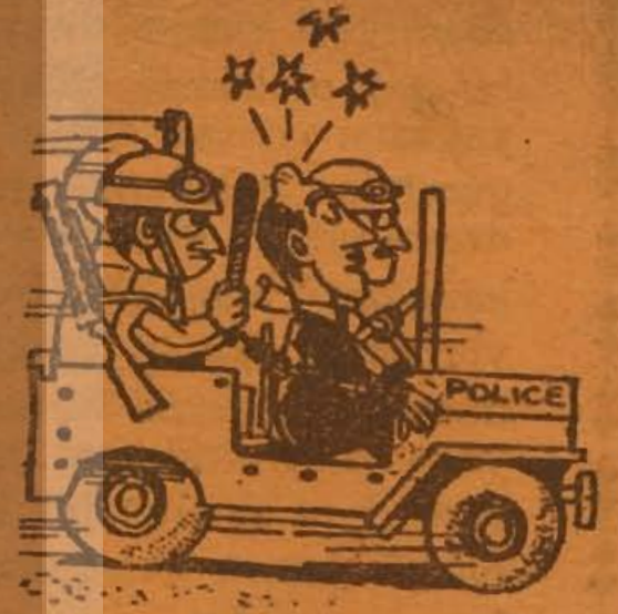
— Şimdi rahat (Amerikan Karikatürü)