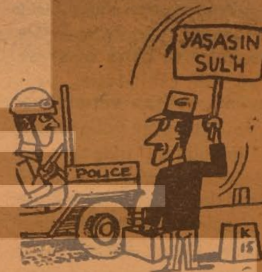
— Belki bunun faydası olur.