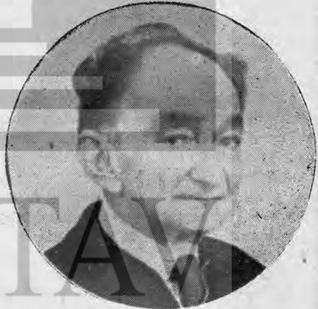
Prens Sabahaddin'in son resimlerinden.

XIX. asırda müspet ilimlerin fazla gelişmesi, insan zekâsının tabiat kanunlarını keşfe başlayarak ona hâkim olma teşebbüslerindeki başarılar; sosyal buhranlara deva arayan düşünürleri de harekete getirerek,