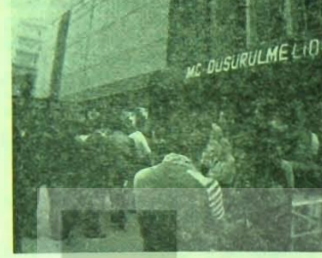
PARTİ GECESI : PARTİLİ SANAT VE DEVRİMCİ COŞKU

Genel Başkanımızın konuşmasının dünya nın durumu ve Türkiye'nin dış politika sorunlarını irdeleyen bir bölümü diğer sütnlarımızda bulunmaktadır. Konuşmanın tam metni ise bastırılmakta olup, Parti yayınları arasında çıkacaktır.