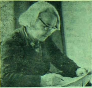
Behice BORAN GENEL BAŞKAN

ran'ın 1951'de tutuklu iken bir oğlu oldu.