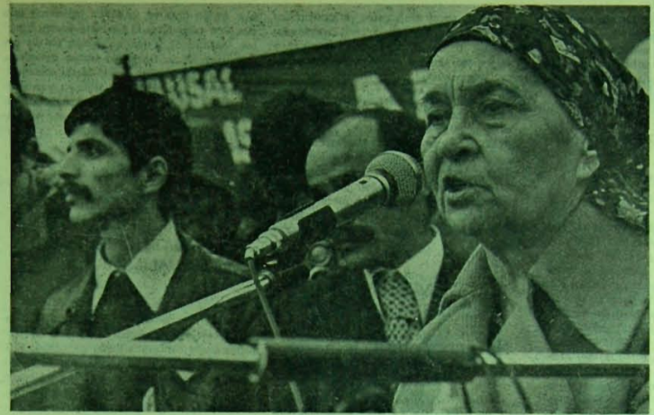
Genel Başkan Boran Ankara Mitinginde İlericilere yurtseverlere demokratlara seslenirken

Emperyalizmin odakları gelişmiş kapitalist ülkeler NATO gibi bir askeri antlaşmaya ve örgütlenmeye neden gerek gördüler? Şundan ötürü: