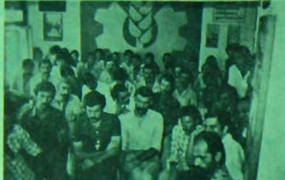
Tarsus İlçe Kongresi

Çankaya ve İzmir Merkez ilçe kongreleri aynı gün (23 Temmuz 1978) yapıldı. Üyelerinin yüksek oranda katıldığı her iki kongreye yönetin kurullarının sundukları raporlar bilimsel sosyalizmin ışığında somut sorunların tartışılması bakımından örnek raporlardı.