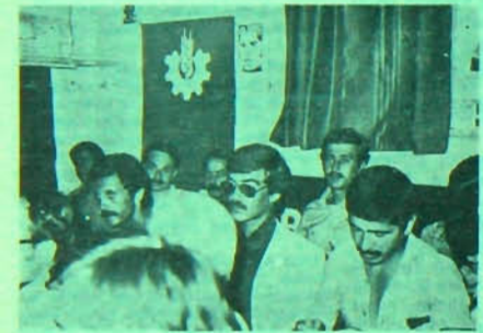
KZD Ereğli İlçe Kongresi

Ekiplerin işlerlik kazanmasından bir süre sonra ise semtte üye kazanımı da kazanmıştır. Bu olay birkaç yönüyle birlikte düşünülmelidir. Birincisi Partimizin asıl amaçlarından birisi olan işçileşme kitleler arasında partiyi üye kazanmak ve işçi sınıfı içerisinde örgütlenmeyi geliştirmektedir. Diğer bir yanıyla işçileşme semtlerde çalışma yapan ekip üyeleri fabrikalarda çalışan işçi üyeler kazanarak işçileri ekipleştiriyor ve örgütlenmeye gerekli şartları oluşturmaktadır. Öte yandan ise ekip anlayışımızı yerleşik olmakla yaşamaya geçiriyoruz demektir. Bu noktadan sonra artık çalışmaların işyerlerine kaydırılması bir zorunluluk tasamaktadır.