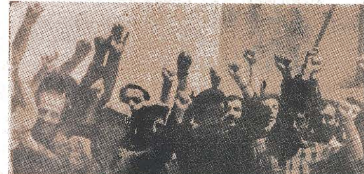
XII : 1 SAYI : 2