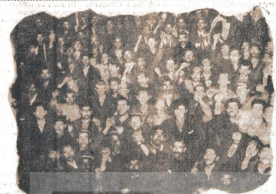
Devletin toprağını işgalde değil, sınıfların hakları için et

Merkiz Tarustu'nun bulunan DİSK Üst Tüm - İş sendikası, 700 işçilik Tarustu Basmacı fabrikasında işçileri işleri bırakmalarına zorlamak için grev kararı aldı.