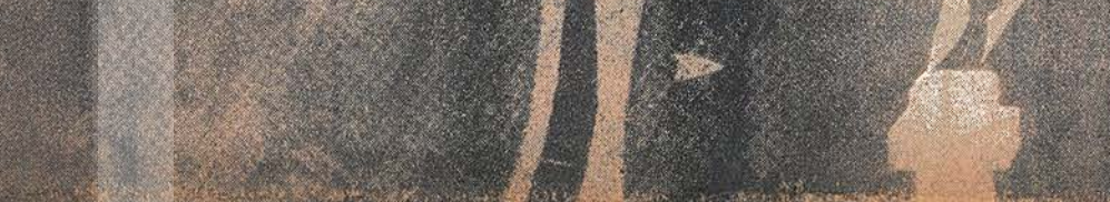
Yöneticilerin korkusu ve yankılarında biz var...