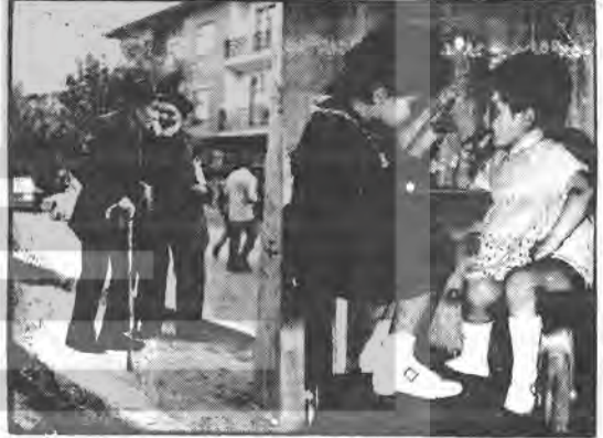
İNSANLAR KONUŞA KONUŞA...

Yeni seçilen Ankara Belediye Başkanı Vedat Dalokay Kızılay altgeçit inşaatıyla ilgili açık oturum düzenlemiştir. Eski Başkan Ekrem Barlas'ın da izlediği bu oturumda Dalokay e- linde ki belgelere dayanarak Barlas'ın yolsuzluklarını şöyle açıklamıştır: "Geçidi yapacak olan müteahhit firma, bir yıldan fazla kendisine yer teslimi yapılmasını beklemiş, belediyeden bir ses çıkmayınca tazminat davası açmıştır. Belediyeden taahhütlerine sadık kalmadığı için 6-9 milyon lira tazminat isteyen firma ile Barlas yeniden masa başına oturmuş ve firmaya istediği tazminatın avans olarak verilmesini kabul etmiştir". Dalokay açıklamasında açılan çukurun 7-10 bin metreküplük kısmının belediye tarafından kazıldığı, müteahhidin ise ancak 1-2 bin metreküplük kazı yaptığını söylemiştir.