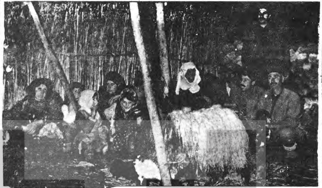
Burası Türkiye'nin Doğusu. Evi olmayan insanlar hay- vanlarıyla birlikte çadırda yatmaktalar...