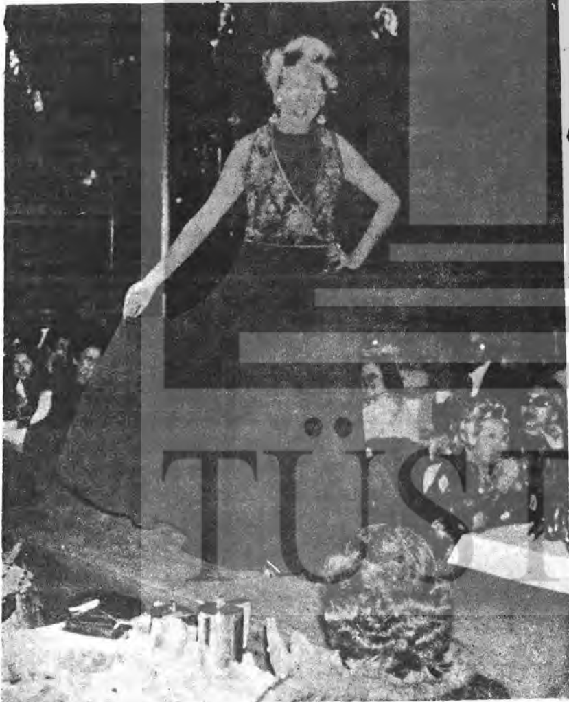
Hilton Oteli'nin balo salonunda yapılan defilede takdim edilen tuvaletlerden biri

ELBİSELERİN DEĞERİ 450 - 20.000 BİN LİRA ARASINDA DEĞİŞİYORDU