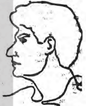
Şair Hasan Hüseyin

bu demir divriği dağlarından ben söktüm ulan ben=söktüm bu namlu divriği demirinden ben döktüm ulan ben döktüm