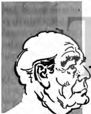
TEKİN ARIBURUN, Senato Başkanı...

Baş vuranlar belediye ilgililerince sınavdan geçirilmişlerdir. Ancak bu kadar çok adayı birden sınav yapabilecek yer bulmak hayli zor olmuştur.