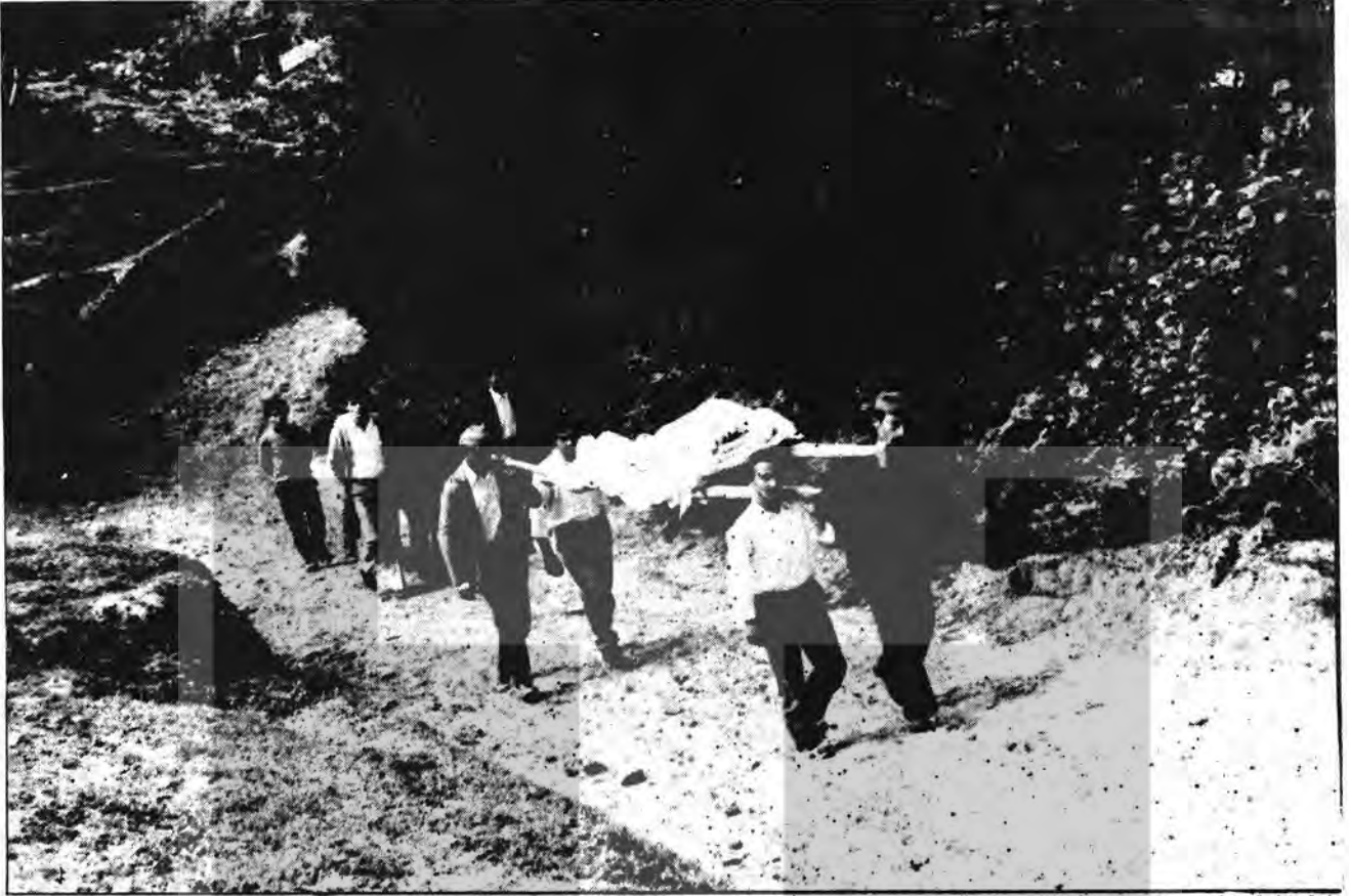
30 kilometrelik yolları yapılmadığı için doğum sancısına tutulan kadınlarını sallarla dağ-bayır ve tepelerden şehirdaki doktora yetiştirmeye çalışan köylüler görülüyor ...