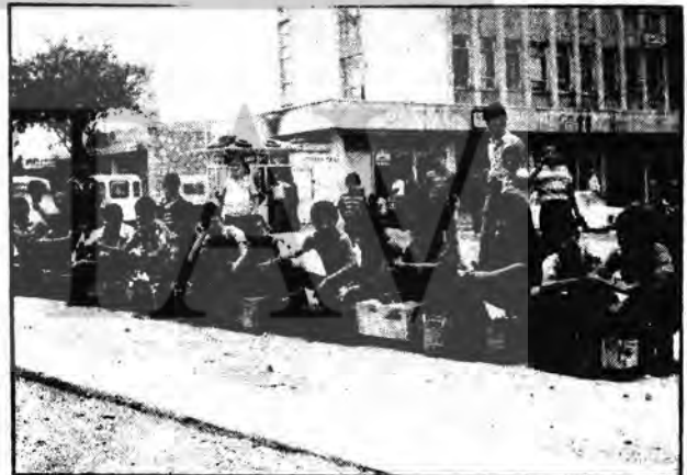
Siirt'in boyacı öğrencileri

Siirt'te okul çağındaki çocuklar, okul masraflarını temin edebilmek için kundura boyacılığı yapmaktadırlar. Çocuklar, çeşitli masraflarını karşılamak için, zamanlarını oyunla geçirmek yerine ayakkabı boyacılığının başında değerlendirilmeye çalışmaktadırlar. Böylelikle yalnız tüketici olmaktan çıkan çocuklar hem de ailelerine yük olmadan, öğrenimleri için gerekli parayı kısmen de olsa elde etmektedirler. Siirt'te öğrenim ile birlikte harçlık kazanabilmek için boyacılığının başında müşteri bekleyen çocukların kazancı günde 20-30 lirayı bulmaktadır.