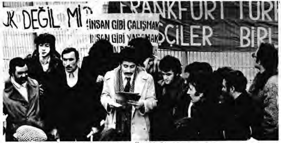
BASIN TOPLANTISINDA SÖZCÜMÜZ KONUŞUYOR.