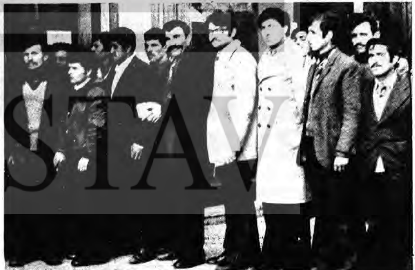
Almanya masahı bitti, LIBYA BAŞLADI