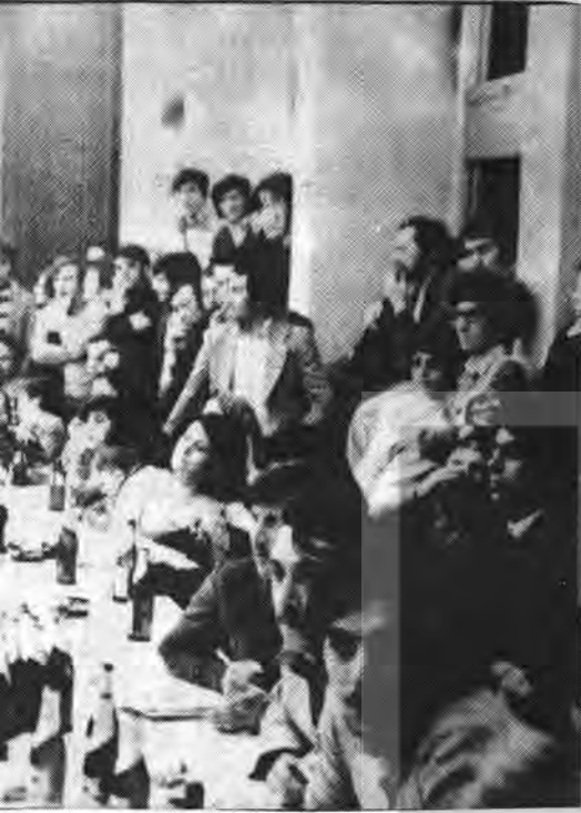
ayakta izledi... AVRUPA TÜRKİYELİ (Altta) söylediği devrimci işçi