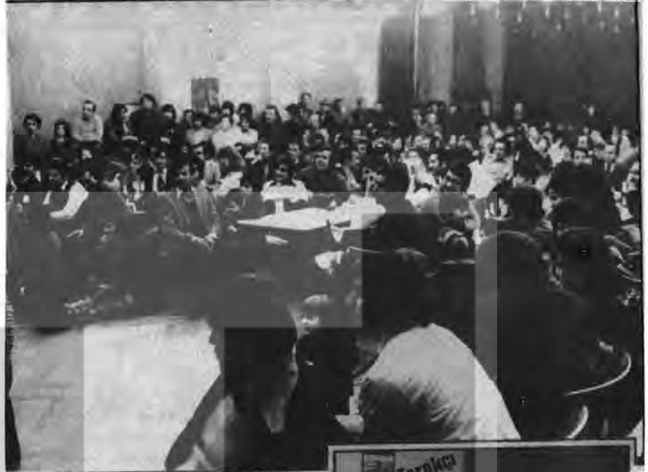
Yukarıda biz, aşağıdaki resimde onlar...