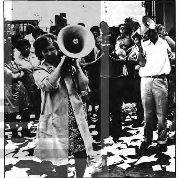
NEUSS GREVİNDE KADIN VE ERKEK İŞÇİLER PATRONA KARŞI OMUZOMUZA MÜCADELE VERİYORLAR.

O tarihten itibaren 8 Mart, kapitalist ülkelerdeki kadınların demokrasi, özgürlük, barış ve kadın haklarının savunulması uğrunda savaştaki yeni bir atılım günüdür. Aynı gün Sosyalist ülkelerde kadınların bir bayramı ve dayanışma günü olarak kutlanır.