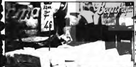
Beyazı 40, Tulumu 46 lira

Evet zeytin, Türkiye'de bugün çoğunluğun yediği zeytin, havyar gibi kıymetli oldu. Kilosu 24 liraya satılıyor. Ekmeğe katkı edilen zeytin geçen yıl tam bugünlerde 10 lira 50 kuruşa satılıyordu. Bir yolda kiloda 14 lira fark var. Neden?