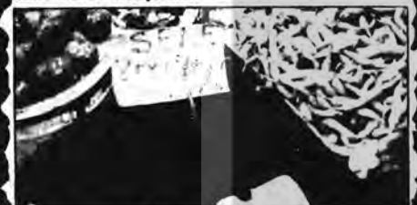
Kahvaltılık zeytin 24 lira

Bugünkü yazımız resimli. Aslında resim, yazıdan daha çok etkilidir. Araplar bunun için fotoğrafı "Tasvir" diyorlar. Ben, bugün önümüze İstanbul'un en ucuz pazarlarından biri olan Mısır Çarşısı'ndan tablolar sunuyorum.