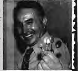
Kaşığın tanesi bin lira

Tarihi eserlerin bir milyon liraya satıldığı müzayedede İstanbul'un en büyük müzayedesi yapıldı.