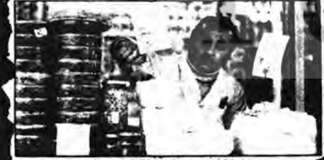
Tereyağı 70, Trabzon yağı 80 lira

Peynir etten bile pahalı. Geçen yıl beyazpeynir 20 liraydı. Bu yıl 35-40 liraya satılıyor Mısır Çarşısı'nda. Tulumpeyniri 46, kaşar peyniri ise 55-60 lira. Ama buna mukabil el geçen yıl 30 liradan satılırken bu yıl 32 lira. Neden?