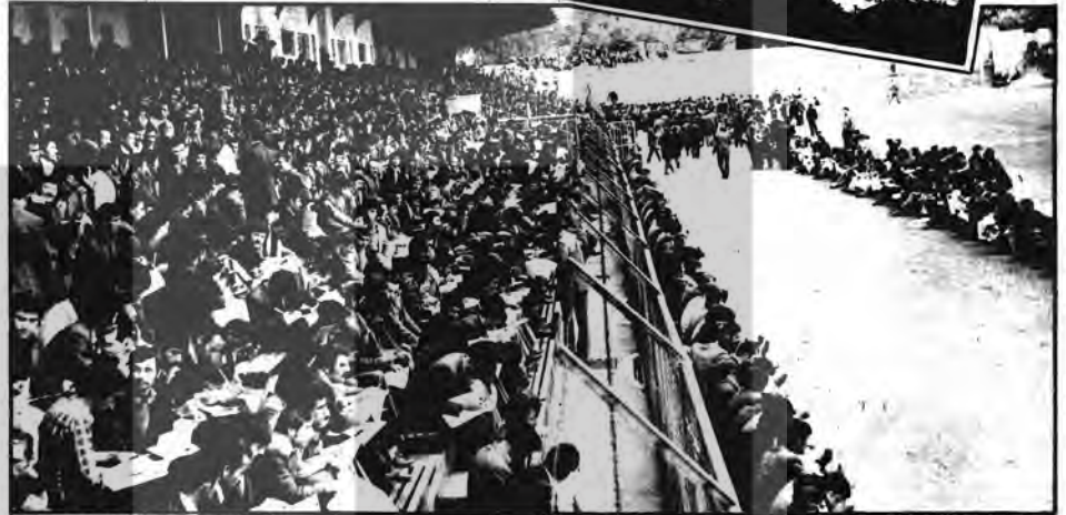
ŞANS HANGİSİNE GÜLECEK : Karabük Demir Çelik Fabrikasına alınacak 17 bakçılık için tam 3301 kişi başvurdu. İşe girmek isteyenlerin çokluğu karşısında sınav yeti olarak Yenisehir Stadyumu tahsis edildi. Sınava katılanlar, teker teker ve giriş

kartlarını göstererek turnikeden geçtiler. Bu kalabalığa tribünler de yetmişince bu defa bakçı adayları için sahannın içi sınav yeri haline geldi. Karabük halkı, stadyumdaki kalabalığı haber alınca büyük bir merak yapıyor sandı. Ve büyük bir ilgiyle Yenisehir Stadyumu'nun yolunu tuttu.