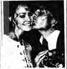
Kapitaleigner und Playboy Gunter Sachs (PLAYBOY-PATRON GÜNTHER SACHS'ın)