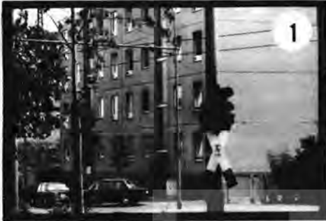
Seehof Str.48-50, saldırganlar burada yataklaniyor.

6 Frankfurt/Main, Bockenheimer - Adalbert Str. 29