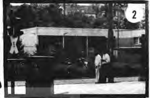
Olayın geçtiği avlu.