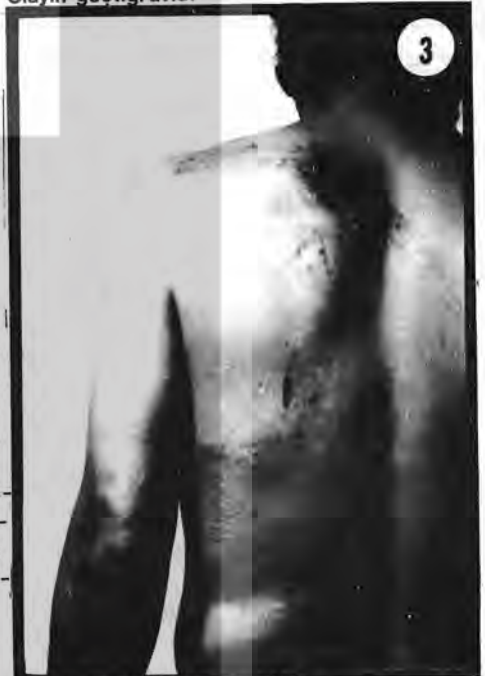
Çeşitli morartı ve yara yerleri.