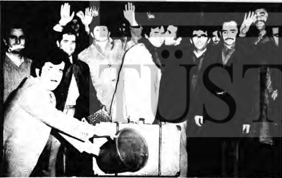
Bir lokma ekmek için gurbete gidenler, yolcu edilirlerken...

Halbuki fabrikalarda biz çalışıyoruz, biz idare etmeliyiz. Ülkenin yönetimide bizim elimizde olmalı. Başka türlü, fabrika sahipleri olan üç kağıtçıların pençesinden kurtuluşumuz yoktur.