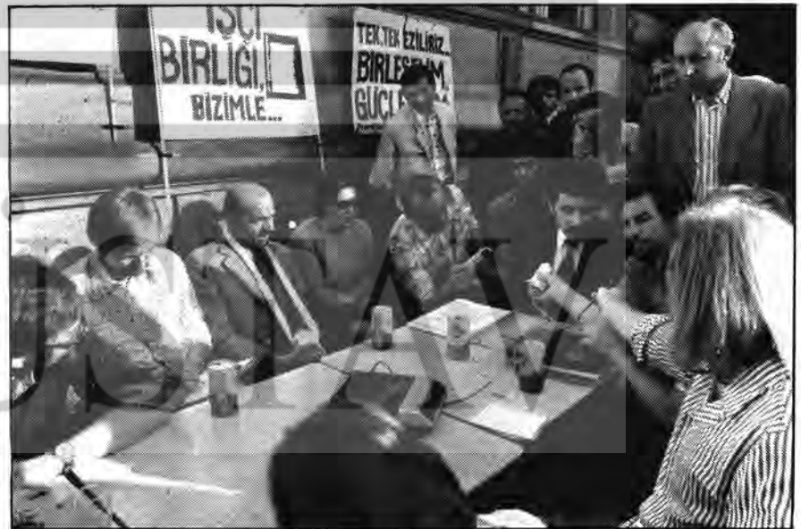
İLGİ TOPLAYAN BASIN TOPLANTISINDAN BİR GÖRÜNÜŞ