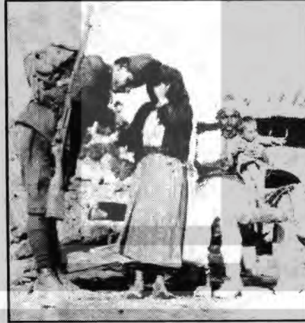
DÜN EMPERYALİZMLE SAVAŞAN ÜNİFORMALI HALK ÇOCUKLARI, BUGÜN ANTI-EMPERYALİST İŞÇİLERİN İLERİCİLERİN ÜZERİNE SÜRÜLÜYOR