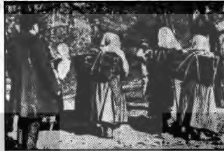
HALKIN KAPIDAN KOVDUĞU EMPERYALİZMİ BURJUVAZİ BACADAN GERİ ALDI