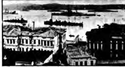
GİTTİ İŞGAL DONANMASI, GELDİ 6. FİLO...