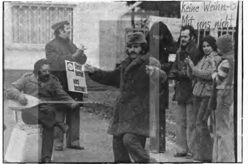
Grevciler yüksek bir moral içindeler. ATTF, İşçi Birliği ve Halkevinin düzenlediği toplantılarda işçi dayanışması da gelişmekte, güçlenmekte.