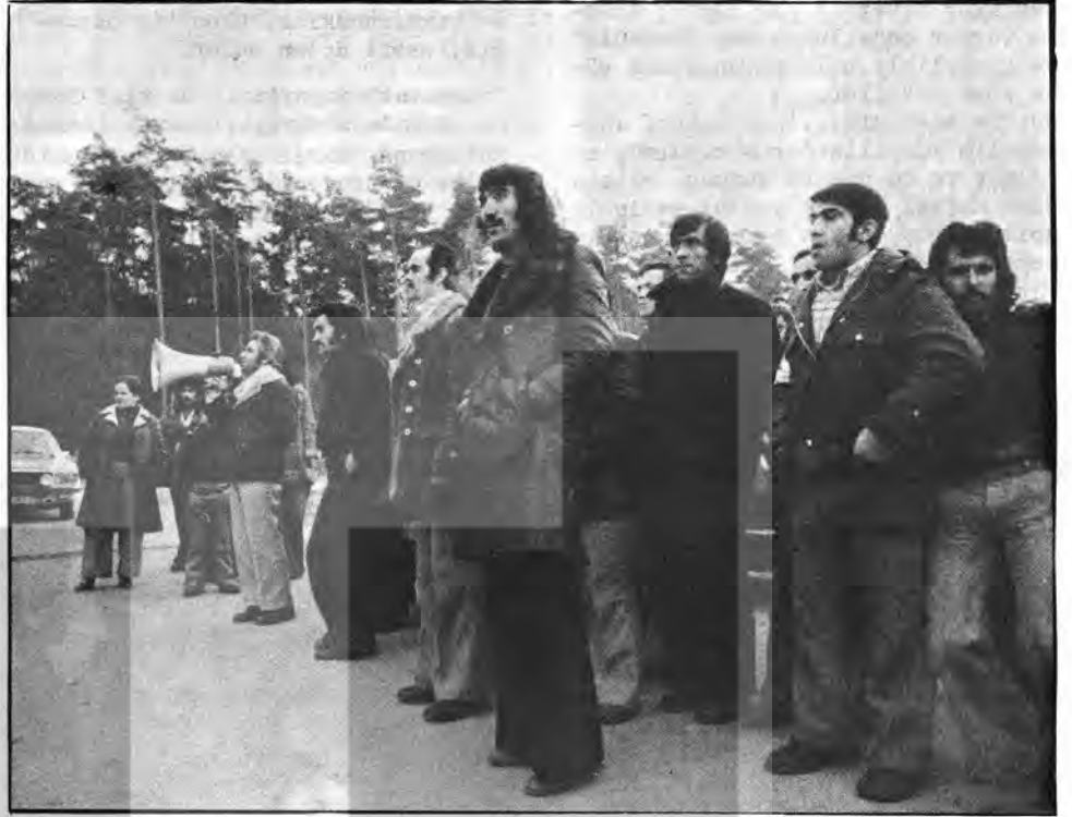
Fabrika önünde her gün grev kırıcılara çağrılar yapılıyor. Maoocular, Troçkistlere, her türlü bölücülere karşı ise saflar sıklaştırılıyor.

Aralarından birkaçının patrona satılmış olmasına rağmen 99 işçi şu anda grevde, yarısından çoğu da kadın. Disiplinle ve sağlam bir moralle sürdürüyorlar grevlerini. "Patron ya iş teklerimizi kabul eder ya da fabrikayı kapatır." diyorlar. Artık hepsi güvenli. Sendikalarının eşliğinde tüm devrimci, demokratik kuruluşların ken dilerini desteklediğini biliyorlar. Birliklerinden kıvanç duyuyorlar. Bundan sonra da mücadelelerini sürdürmeye azmetmişler çünkü kendilerini patronlara ezdirmemek için birlikte mücadeleyi öğrenmişler.