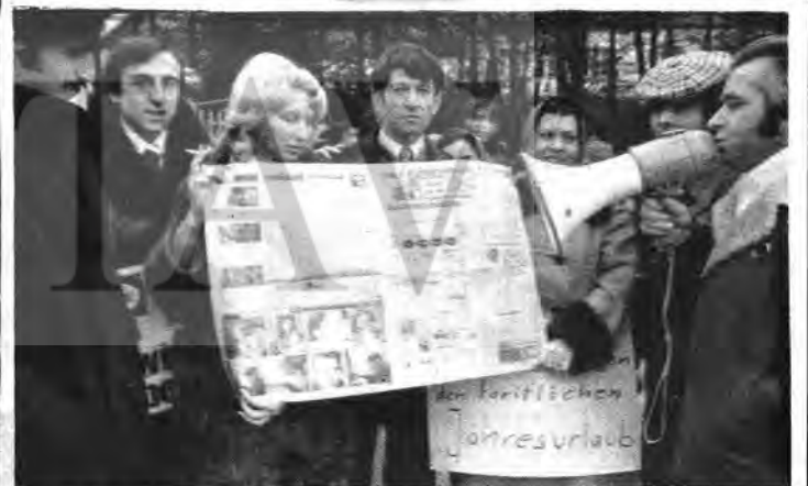
Elles patronunu övücü yazılar yazan Tercüman Gazetesi kimden yana olduğunu bir kere daha gösterdi. İşçiler tarafından iftiharla pazara çıkarılan gazete topluca okunur ak yuhalanmıştır.