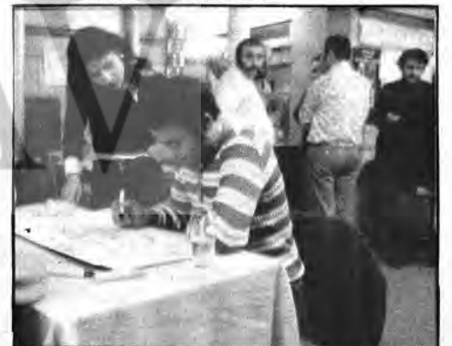
Grevde dayanışmanın en iyi örneği veriliyor. Üstte slogan yazan Türk ve Yunanlı işçi birlikte görülüyor.