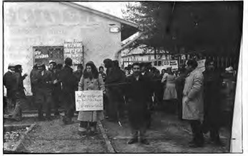
Düzenlenen direnişlerle grev kırıcıların zaman zaman fabrikaya girişi geçici olarak engellenmekte. Çağrılar yapılmakta.