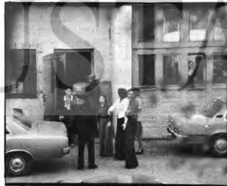
ELES patronu dışarda kaçak iş yaptırma, grev kırıcılarını kullanma gibi metotlara baş vuruyor.