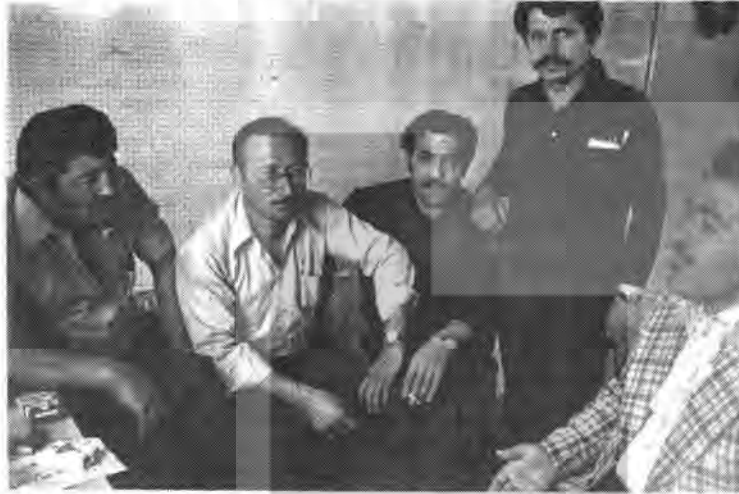
Opel Yurdunda sohbet.

Opel fabrikasının 12 numaralı Heim'ında kalan Türk arkadaşları ziyaret ettik. Kötü koşullar altında bulunuyorlar. Her türlü sosyal lanaktan mahrum, adeta bir kışla hayatı yaşamaktadırlar. "Biz dünyadan koştuk, Opel yedi bitirdi bizi. . . Siz burada, ortalıkta gezen arkadaşlara bakmayın, onların içi boşaldı elbisesleri geziyor" diyorlar. Kısada olsa bu sözler Opel'deki arkadaşların ne durumda olduklarını anlatıyor.