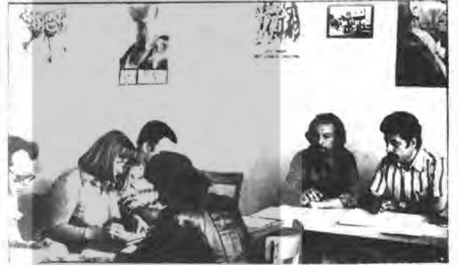
Basına bilgi veriliyor

17.6.1976 günü akşamı faşist MHP'liler Rüsselsheim Türkiye İşçi Birliğine bir saldırı düzenlediler. Bilinmeyen kişiler, Birlikte kimse bulunmadığı sırada bütün camları kırarak kaçtılar. Rüsselsheim'da gerçekten işçiden yana olan bu örgüte yapılan saldırı nefretle karşılandı. Derhal biraraya gelen 6 işçi örgütü gereken kanuni yerlere başvurdukları gibi Hessen İçişleri Bakanına da bir açık mektup gönderdiler. 21.6.1976 günü de RTİB lokalinde bir basın toplantısı düzenlendi. Birçok Alman gazetecinin katıldığı bu toplantıda MHP'lilerin Rüsselsheim ve çevresinde yaptıkları eylemler konusunda geniş bilgi verildi.