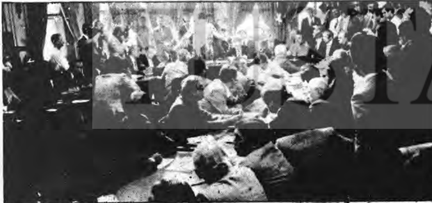
İstanbullu sanayici ve işadamlarının sorunlarını dinleyen Demirel toplantıda...

Soyuyorlar... Soyuyorlar... Hemde öyle gizli kapaklı değil, açık açık. Demirel soyguncularla, vurgunun kaçtan kaçta çıkarılacağına planını yapıyor.