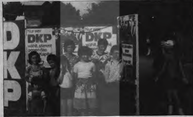
PİONIER TEŞKİLATINDA TÜRK ÇOCUKLARI.

★ Biz genç piyoniyerler, açık yürekli, dürüst ve yardım sever iyi arkadaşlar olmak istiyoruz.