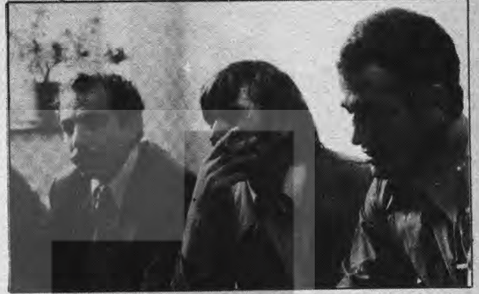
OPEL İŞÇİLERİ — Pis yataklar ve kışkırtıcı kişilerden yakınıyorlar.

ğanda işçilerin uyanıklığı sayesinde tutmamıştır. Şunu açıkça söyleyelim ki arkadaşlarımızın dini inancına saygımız vardır. Dolayısıyla onların manevi duygularına saldırmamız söz konusu olmaz. Dertlerimiz, problemlerimiz ortaktır. Hepimizi bu hale getiren, el kaplarına atan kapitalist düzenin kendisidir. Biz bu düşmana karşı birleşmeliyiz ve Ziya Güney gibi soygunculara çanak tutanlara fırsat vermemeliyiz.