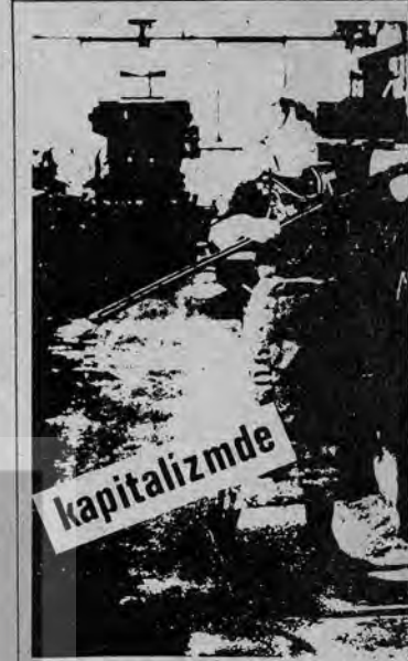
Sosyalist ve Kapitalist kadını emekçi olarak değer görüyorsunuz

1976 yılı biterken gerek Türkiye'de gerek Almanya'da kadın işçilerimizin mücadeleleri de hızlanmaktadır