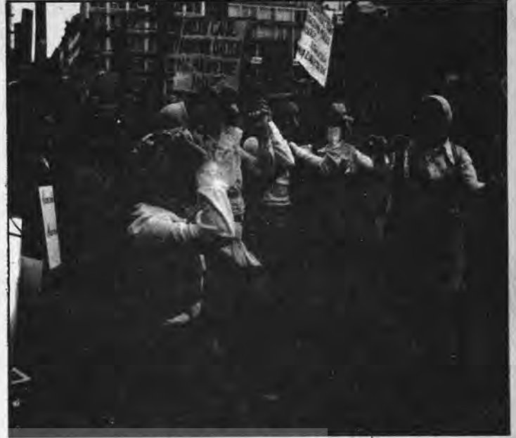
"ÇOCUK FOLKLORU" basın toplantısında

Basın toplantısında kendisiyle konuştuğumuz başka bir öğrenci velisi ise şunları söyledi "Ben 6 senedir Almanya'da işçiyim. İki ço-