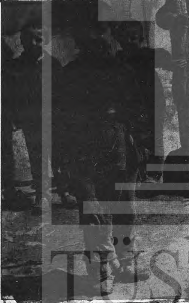
YURTTA ve ALMANYA'DA ÇOCUKLARIMIZ- Onlar için gündüzlerinde sömürülmeyen, gecelerinde aç yatılmayan, 23 Nisanlar diliyoruz.

Bunun üzerine yerli yabancı işçiler aralarında imza toplayıp, işçi temsilcisi ve sendika temsilcisi kanalıyla durumu protesto etmişlerdir. Çalıştıkları saatleri ispat ederek de hakları olan 2000 DM'ı geri almışlardır. Sendika ile birlikte mücadele sonunda haklarını aldıklarını gören işçilerden sendikasız olanları da sendikaya üye olmuştur. Türk işçileri arasında sendikasız sadece 2 kişi kalmıştır.