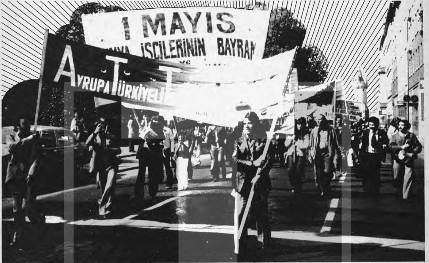
Geçen yıl 1 Mayıs'ta İşçi Birliği yürüyor...