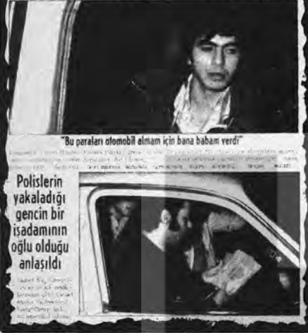
"Bu paraları otomobil almam için bana babam verdi"

Üzerinden 255 bin lira çıkınca banka soyguncusu sandılar