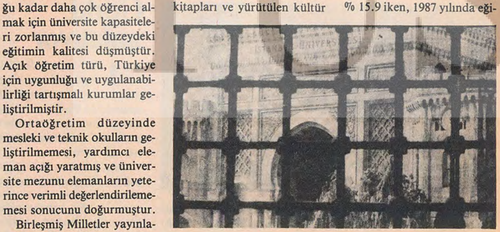
Universite: Bilim üretilen ve açık tartışma ortamının var olduğu bir yer mi?

kın özelliği sürmüştür. Gerlasık dörtte üc coğunluk, ye- Gerici siyasal iktidarların çekçi tahminler mesleki ve tekterli bir eğitim görmediği için kültüre ve öğretim programla- nik öğretimin gerekli düzeye issizler ordusuna katılmış ve rına sürekli müdahalesi ders çıkmasının uzan yıllar gerekcamalar karşılıksız kalmıştır. na, pek çok bilginin sansürü- 1983 yılında eğitim bütçesinin Universiteye sosyal talebi ne veya değiştirilmesine yol aç- toplama oranı % 10.2, savunkarşılamak ve mümkün oldu- mıştır. Şu anda okutulan ders ma bütçesinin toplama oranı