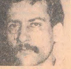
yaralanan öğrencilerden Sü

8 Mart'ta, Eskişehir Anadolu Üniversitesi, İktisadi ve Tieari Bilimler Fakültesi kantininde oturmakta olan ilerici öğrencilere saldıran faşistler, 4 öğrenciyi yaraladılar. 15 kişi ldukları bildirilen fasistlerin okulda tanındığını, Türkeş'in Eskişehir'e gelmesi sırasında bıçaklı bu saldırının, sindirmeve yönelik olduğunu belirten