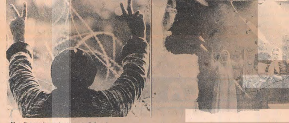
"Yahudi olmayan" herşeye düşman gözle bakılıyor