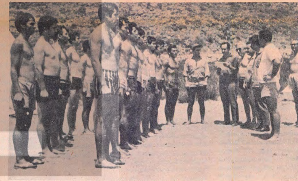
MHP'li Komandolar '80 öncesinde eğitim kampında...

Hitler selamı gibi elini yukarı kaldırarak mahkeme salonuna girdi ve orada bulunan 432 sanık oturdukları yerden ayağa kalktı ve topuklarını birbirine vurdular, ellerini yukarı kaldırdılar ve istiklal marşını söylediler. 1981 yılı Ağustos ayında Ankara'daki bir asker mahkemede bozkurtlar, kendileri gibi sanık durumunda olan liderleri Türkiye'yi böyle selamlıyorlardı. 600'den fazla öldürme ve 220 cinayet yargılanmasının yapıldığı dava 6 yıl sonra Türkiye'nin parti lideri olarak MHP'nin de masum bir parti olarak aklanmasıyla sonuçlandı. O dönemlerde askeri mahkemelerin sol partiler ve solcu bilinen kuruluş ve kişilere biçtiği cezalar hatırlanırsa, MHP davasının göstermelik olduğu anlaşılır. Türkiye ve ceseti tekrar ortaya çıktı. Cezasının bir kısmını tutuklu olarak geçiren ve kalamı affedilenler Türkiye, geleceğe güvenle bakıyor. Kendisi tarafından yönetilen MÇP, MHP'nin devamı şeklinde gelişiyor.