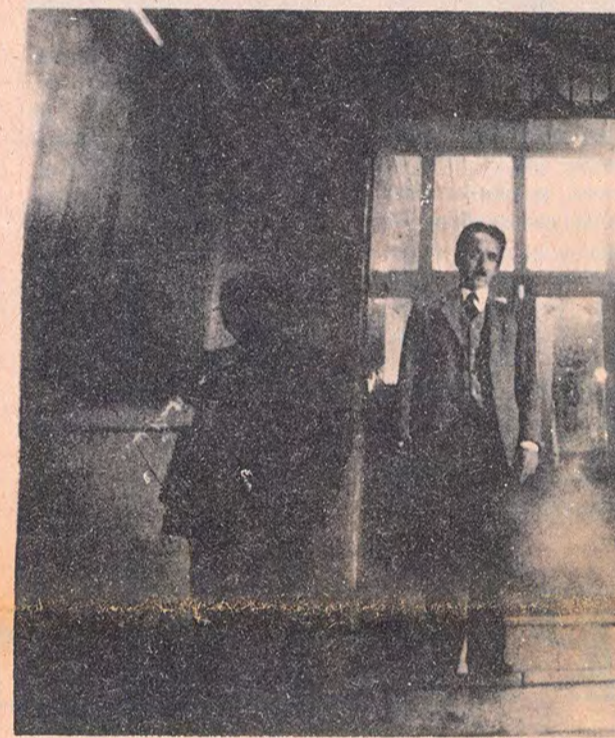
'Anayurt Oteli'nden bir görüntü

Kendisiyle yaptığımız söyleşiyi Kültür-Sanat sayfamızda okuyabilirsiniz.