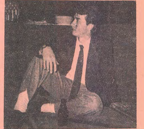
Konyalı olmak varmış!..

Yalnız burada bizce öğretmenimiz bir şeyleri atıyor. Neden ülkemizde böyle bir eğitim sistemi uygulanıyor? Öğretmenler ruh hastası, sadist mi? İşte yaşanan çarpık eğitim sisteminden herkese bir örnek daha.