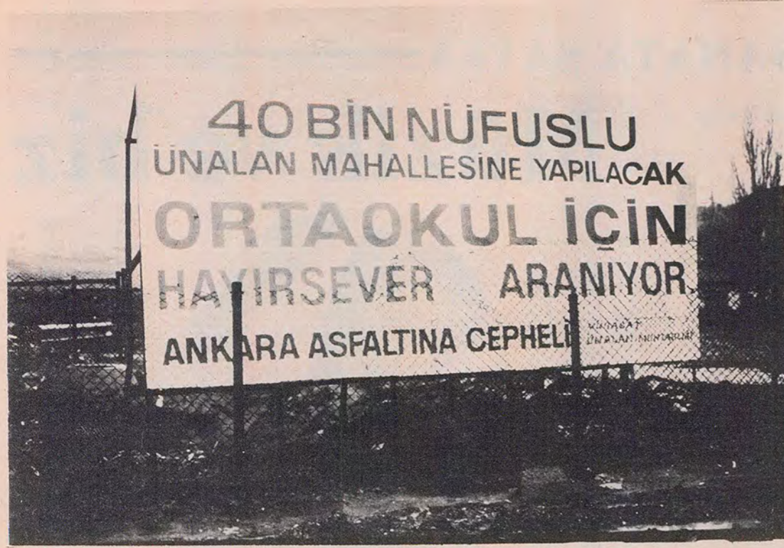
Bu fotoğrafı en başta devlet büyüklerimiz, onlardan sonra da sayın MEGS Bakanımız Hasan Celal Güzel'e hitaben yayınlıyoruz. Türkiyemiz'de eğitim ve öğretimin gerçekte ne durumda olduğunu gösterebilmek için yayınlıyoruz.