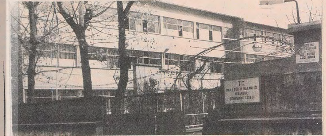
Okul mu, cezaevi mi?

Biz sadece, okulun kapısına yaklaştıkça "Acaba