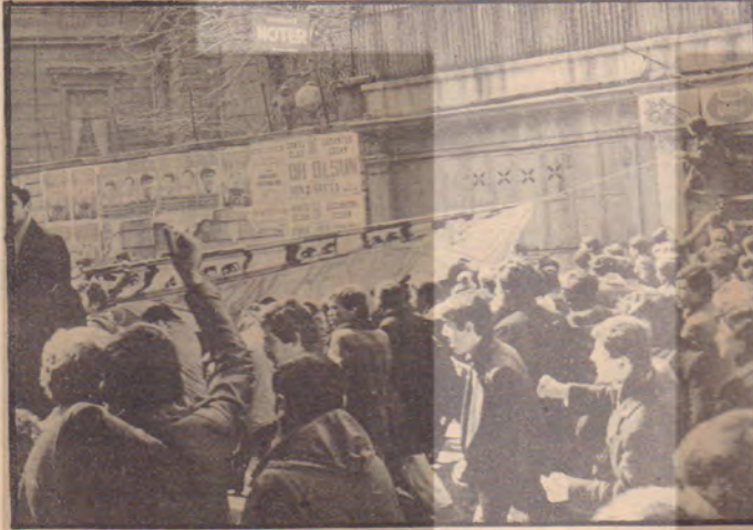
16 Mart 1980 Taksim-İstanbul

• Edebiyat Fakültesi'nde, yine Dev-Yol, Dev-Sol ve Kurtuluş yanlısı gençlerle ilerici gençler öğrencilere saldıran faşistleri püskürttükleri, okulu boykot eden öğrenci kitlesine güvenlik kuvvetlerinin ateş açması sonucu bir kişinin yaralandığı ve kahvelerin basılması