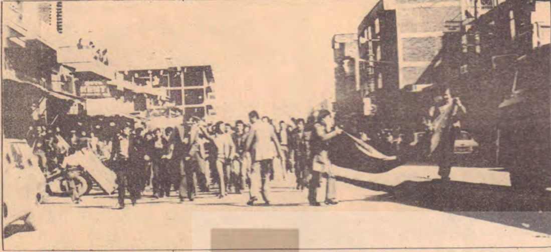
16 Mart 1980 Diyarbakır

Barış Derneği 2. Genel Kurul çalışmaları içinde yeralan «Gençler ve Öğrenciler Yuvarlak Masası»nda biraraya gelen ilerici gençlerin, genç öncülerin, sosyalist gençlerin, devrimci demokrat gençlerin bu ortak etkinliği eylem birliğinin örülmesinde ileri bir adım olarak nitelendirilmektedir. Ne var ki, sosyalist gençlerin daha sonra ortak çalışmadan çekilmeleri bu süreci olumsuz yönde etkileyen bir etken olmuştur. Fakat biz, sosyalist gençlerin, barış savaşımındaki yerlerini kısa sürede dolduracaklarına inanıyoruz. Gençliğin barış savaşımındaki etkinliğini güçlendirmeye tüm barışsever gençlik kesimlerinin katkıda bulunmalarının zorunluluğu açıktır.