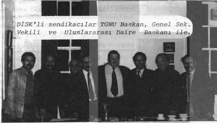
DİSK'li sendikacılar TGWU Başkan, Genel Sek. Vekili ve Uluslararası Daire Başkanı ile.

● 25 Ekim'de İngiliz Kadınlar Birliği Türkiye'deki politik kadın tutuklularla dayanışma için Büyükelçilik önünde tüm gün protesto gösterisi yaptı.