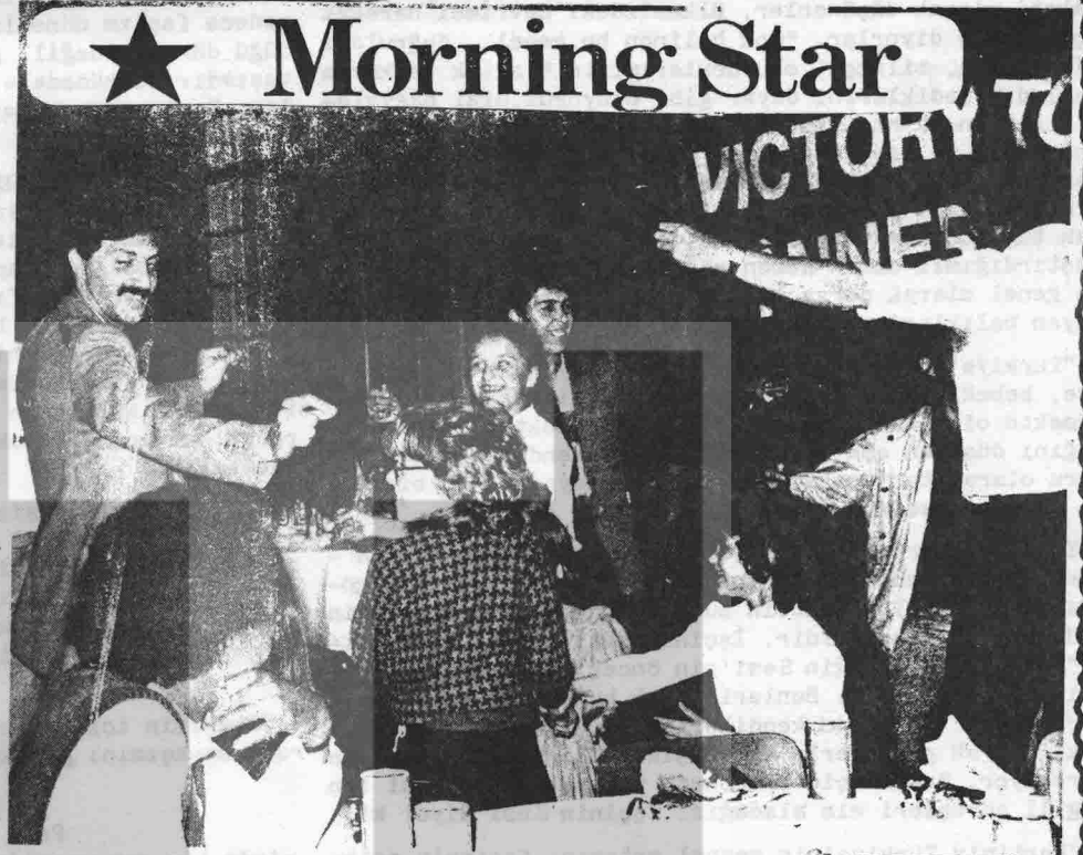
Welsh miners' children learning a Turkish dance or two at a social evening in London, before setting off on their holiday in France.

From London, the children sailed yesterday for Calais where