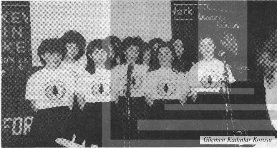
Göçmen Kadınlar Korusu