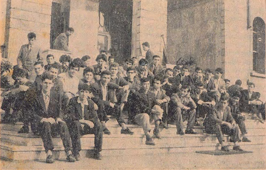
Üniversiteye giremeyen öğrencilerin rektörlüğü işgalinden bir görüntü...

19/EYLÜL Ankara'da gençler 27 Mayıs aleyhtarları son günlerde yapılan yayınları protesto etmek için yürüyüş yaptılar.