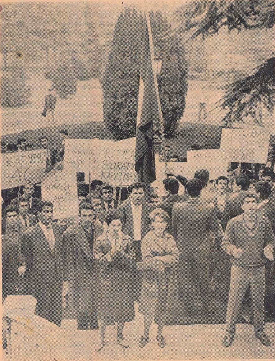
Üniversiteye giremeyen öğrencilerin protesto gösterisi...

10/OCAK Gençler bozgunculara, komünistlere ve gericiilere karşı «Son ihtar» mitingi yaptılar. Mitingte Ata'ya ve devrimlere bağlılık andı içildi.