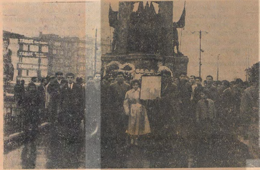
Atatürk heykeline yapılan saldırı sonunda Taksim'de gösteri yapanlardan bir kısmı.

20/ARALIK İskenderunda Atatürk heykeli-nin meçhul şahıslar tarafından parçalanması üzerine bütün yurtta gençler yürüyüşler yaptılar.