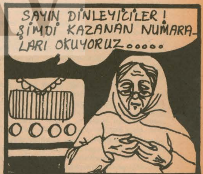
Çalışkan Ailesi'nin NİNESİ: Piyangodan bir ev çıkar umuduyla girdi.