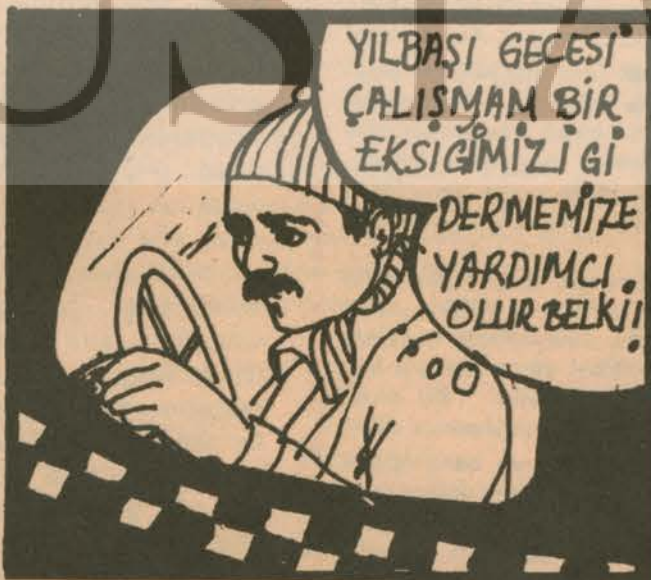
Çalışkan Ailesi'nin BABASI: Yeni yıla fazla mesai yaparak girdi.