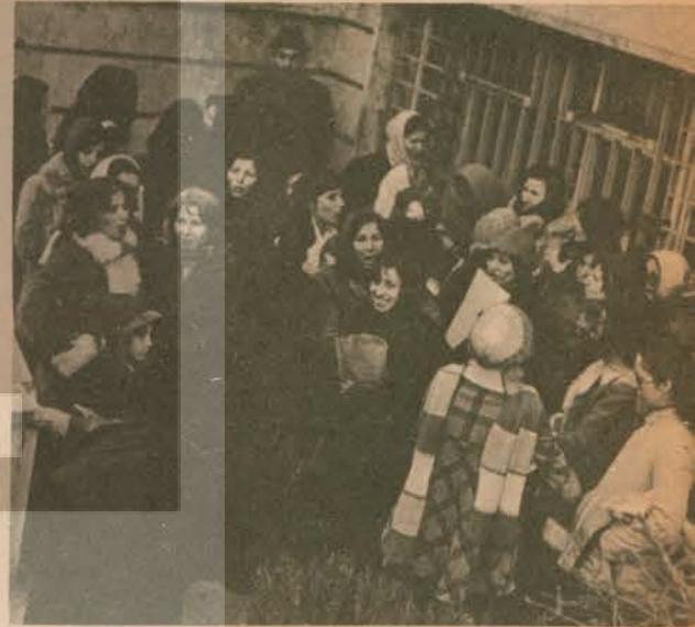
S.S.K.'lı kadınlar direnişte marş söylüyorlar: «Kavga bilen dostlar gelsin!»

— Türkiye'de bugün için kadınlar bilinçlenmiş ve haklarını almış değil. Bizler erkeklerle omuz omuza mücadele edip, haklarımızı almamışız. Mücadelesinde bütün kadınlar yerelmalı. Ev kadınları 24 saat evde çalışıyor. Bu sorunu dünyaya çarpında bir sorun. Evde oturanların da çalışmaları dünyayı tanımaları gerek. Yoksa evde oturan kadın dünyadan habersiz oluyor.