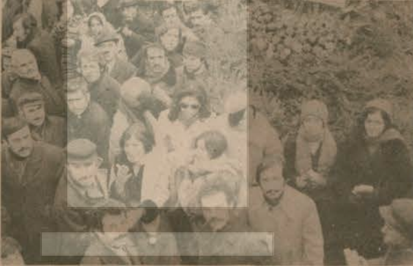
S.S.K. işçileri kadın-erkek birlikte mücadeledeler.

Burada çok kadın çalışıyor ve en ağır işlerde çalışıyorlar. Ençok ezilenler onlar olduğu için ençok onlar mücadele etmeli. Artık yeter diyoruz. Sonuna kadar da direneceğiz. Bütün kadınlar bir ve beraber olsunlar. Madem böyle bir dernek var, ona üye olsunlar, bilinçlensinler İzmir'deki gibi et boykotu yapmakla iş hallolmaz. Ülke çapında hareketler yapmalıyız. Birlikten kuvvet doğar.