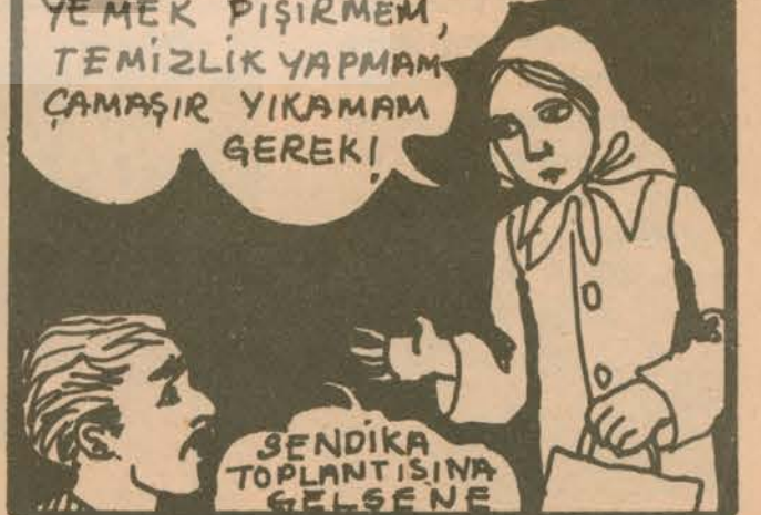
Ve.. Toplumsal hayatta eşitsizlikle sürer.

NASIL GELEYİM, EVDE ÇOCUKLAR BEKLİYOR YEMEK PİŞİRMEM, TEMİZLİK YAPMAM ÇAMAŞIR YIKAMAM GEREKİ!