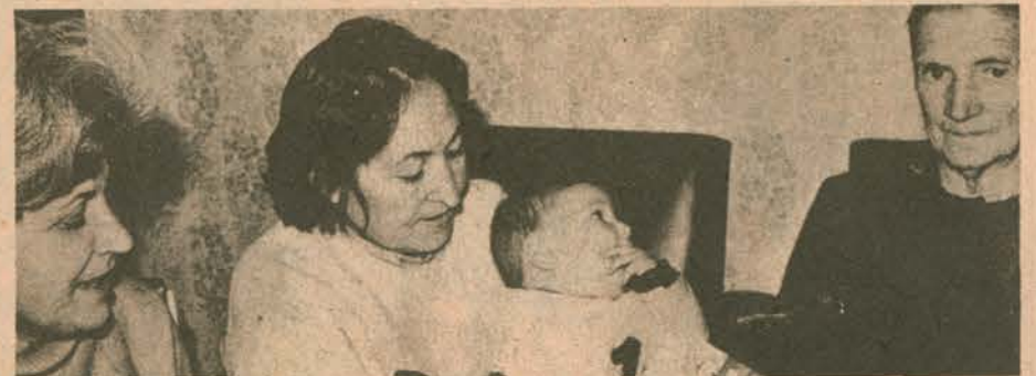
Tutuklu bir İspanyol sendikacısının anası ve eşi açlık grevinde küçük bebekleriyle birlikte..

Ama bütün bunlar, emekçileri faşizme karşı verdikleri mücadele-den döndüremiyor. İspanyol kadınları da direnen kitleler arasında yer-lerini alıyorlar. Tutuklu eşlerinin serbest bırakılması için ölüm orucuna başlayan işçi kadınlar, faşizme karşı mücadeleye yeni bir güç katıyor. Toplumun kurtuluş mücadelesinde kadınların katkısının önemini dün-ya kamu oyu önünde bir kez daha kanıtıyorlar.