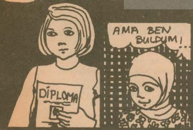
İş bulmada zorluklarla

BEŞ AYDIR İŞ ARIYORUM BİR TURLU BULAMADIM!