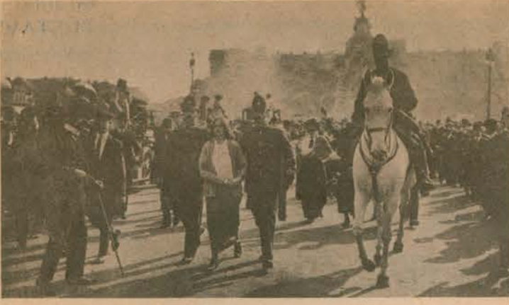
İşte bir eşitlik savaşçısı kadın cezalandırılmaya götürülüyor. Onların bu fedakâr mücadeleleri ile bu günlere gelindi.

«81 milyon kadın adına bizler, kadınların ekonomik, politik, demokratik ve sosyal haklarını savunacağımıza, gelecek kuşakların ve çocuklarımızın mutlu ve özgür gelişmelerini sağlayacak zorunlu koşulları yaratmak, dünya üzerinden faşizm bütün biçimleriyle ebediyen silininceye ve tüm dünyada gerçek bir demokrasi kuruluncaya dek, yorulmak bilmeksizin mücadele edeceğimize, dünya üzerinde sonsuz bir barışın egemen olması için durmaksızın savaşacağımıza AND İÇERİZ.»