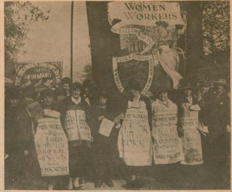
İngiliz işçi ve emekçi kadınlarının verdikleri mücadeleden tarih yaprakları arasından bulduğumuz bu fotoğraf, yaptıkları bir yürüyüşte çekilmiş.

«81 milyon kadın adına bizler, kadınların ekonomik, politik, demokratik ve sosyal haklarını savunacağımıza, gelecek kuşakların ve çocuklarımızın mutlu ve özgür gelişmelerini sağlayacak zorunlu koşulları yaratmak, dünya üzerinden faşizm bütün biçimleriyle ebediyen silininceye ve tüm dünyada gerçek bir demokrasi kuruluncaya dek, yorulmak bilmeksizin mücadele edeceğimize, dünya üzerinde sonsuz bir barışın egemen olması için durmaksızın savaşacağımıza AND İÇERİZ.»