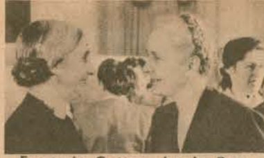
Eugenie Cotton, Lenin Barış Ödülü'nü alırken