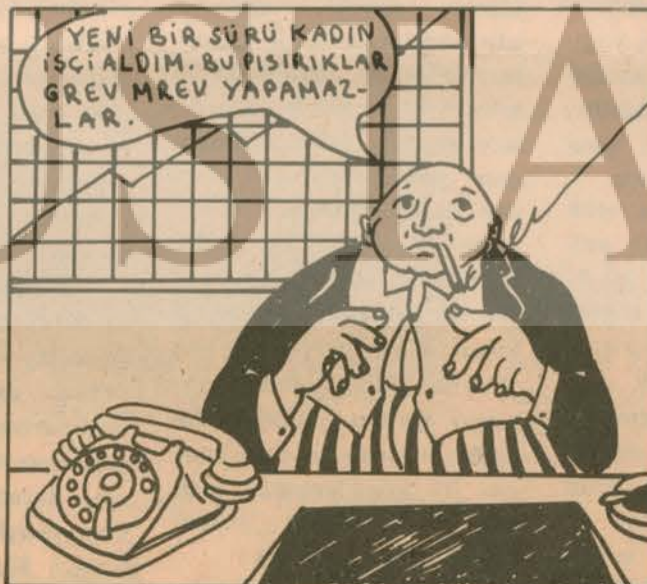
İşveren, işçilerin çoğunluğu kadın olduğundan, grevin başarıya ulaşacağını ummuyordu RAHATTI!