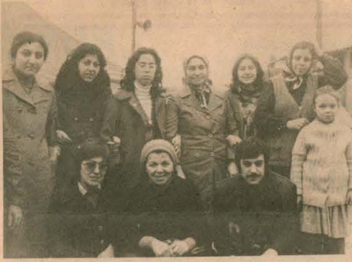
Şahsuvar, PDK, Türk-Telefon, Yün-Teks ve Ratel fabrikasından arkadaşlar birarada.

Dernek üyesi, Gripin, Yün-Teks ve Türk Telefon işçisi arkadaşlarımız grevdeki PDK işçilerini ziyarete birlikte gittiler. Ratel fabrikasından üye işçi arkadaşlarımız da orada idiler. Kadınlar biraraya gelecek grevleri konusunda ve diğer ortak sorunları etrafında sohbet ederek hatıra resmi de çektiler.