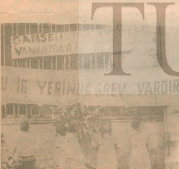
Ayşe'nin çalıştığı HASTAŞ fabrikasında grev kararı alındı.

lerini ispatlıyorlar. Görülüyor ki, bağımsızlık, demokrasi ve ilerleme mücadelesi bugünden yarına daha da yığınsallaşarak ve yüz yıllardır bir kenara itilen kadınları da içine çekerek geliyor, güçleniyor.