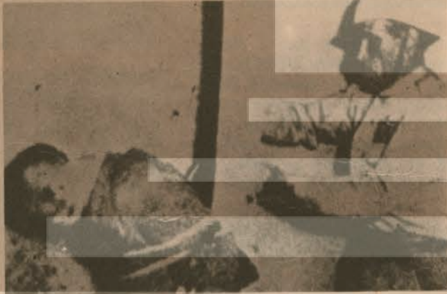
Çağımızda bu tür insan onurunu ayaklar altına alan işkenceler sürüyor.

Çağımız 20. yüzyıl, insanlık bir yandan yapma uydular yapıyor, bir yanda ise insanlığın bir kesimi hala ortaçağ işkencelerine taş çıkartan barbarlıklarla utanç dolu, insan haklarını ayaklar altına alan uygulamalara sahne oluyor.