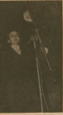
ve folklor çalış-

— Çalışan kadınların 20 yılda emekli olmalarına ilişkin yasanın en iyi bir şekilde çıkarılması için onbine yakın bildiriyi işçi ve emekli kadınlara dağıttık. Gene bu konuda bir imza kampanyası açtık. Topladığımız beşbin adet imza ile birlikte, yasanın istediğimiz şekilde çıkması için Cumhurbaşkanına başvurduk.