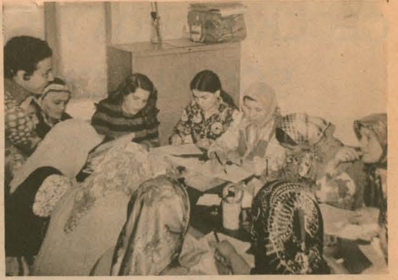
Düzenlediğimiz okuma - yazma kurslarına 100 kadar kadın katıldı.

Derneğimiz Genel Merkezinde her cumartesi günü kadın ve çocuk doktorlarımız ücretsiz muayene ve tedavi yaptılar.