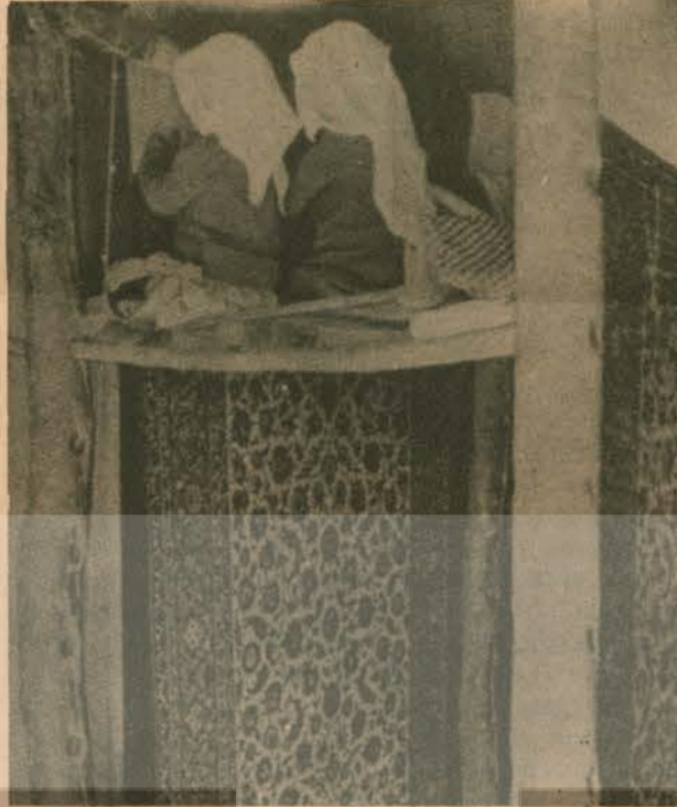
İran'da doğmadan tüccara satılan çocuklar 3-4 yaşlarında halı örmeye başlayarak ücretlerinin karşılığını çıkarıyorlar.

bilir. Yine istatistiklere göre zor yaşama koşulla-rı aileleri kızlarını çok erken yaşta evlendirmeye zorlanmaktadır. Sadece 1974 yılında evlenen 34 000 genç kız 10-14 yaş arasındadır.