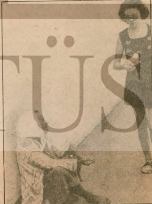
BREZİLYALI KADINLAR BİR LOKMA EKMEK İÇİN DİLENMEK ZORUNDA KALİYORLAR

İnsan haklarının hiçe sayılması, demokratik hak ve özgürlüklerinin çiğnenmesinin yanı sıra Brezilya halkının yaşam koşulları son derece kötüdür. Söz gelişi 1-4 yaş ara-