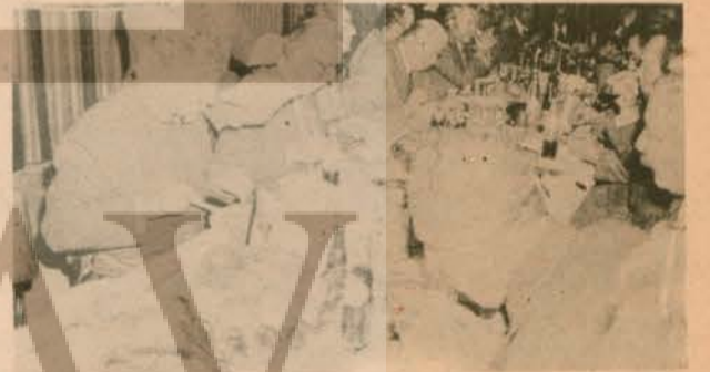
BAKANLAR YEMEK SIRASINDA...

TÜB-DER, TÜH-DER, TÜS-DER, TÜTED, İLERİCİ KADINLAR DERNEĞİ, İLERİCİ GENÇLER DERNEĞİ, İSTANBUL TAFİLER ODASI, İYÖD, DİED, HALFELERİ İL Foord, Furulu İSTANBUL ŞUBELERİ.