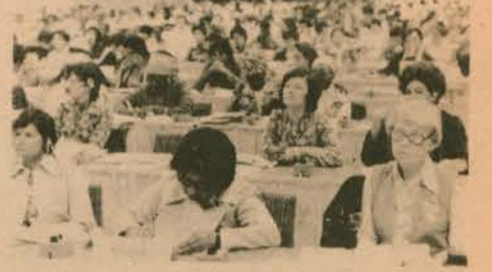
UDKF'nin Berlin'deki toplantıları sırasında Asyalı ve Afrikalı delegeleri birarada görüyoruz.

U.D.K.F. gerek 6 dilde çıkan yayımları gerekse her yıl düzenlediği bir dizi bölgesel ve ulus-