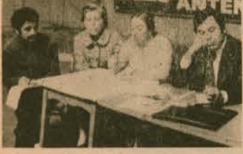
«Gençlerimize Can Güvenliği ve Öğrenim Özgürlüğü» forumuna katılan sözcülerden bir gurup.

Tüm üniversitelerin, akademi ve yüksek okulların açıldığı şu günlerde gençliğimizin en önemli ve güncel sorunu can güvenliklerinin ve öğrenim özgürlüklerinin korunmasıdır. Binbir zorluklarla üniversite çağına getirdiğimiz