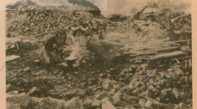
KÖYLÜLER YEMEĞE HAZIRLANIYOR