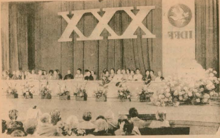
Dünyanın dörtbir yanından 103 kadın örgütünü bünyesinde barındıran UDKF geçen yıl 7. kongresini yaptı.