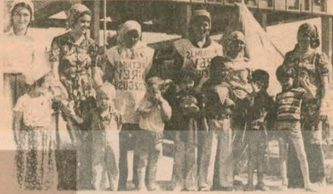
Sendikal mücadelenin ön saflarında çocuklarıyla birlikte yer alan grevci işçi kadınlarımız.

Biz kadınlar patronlara karşı verilen bu ekmek ve özgürlük kavgasında erkeklerle birlikte savaşmamız gerektiğini bilip, sendikalaşma mücadelesine güç katılım ve sendikalarda aktif olarak çalışarak, eşit işe eşit ücret verilmesi, işyerimizde kreş, emzirme odası açılması, doğum öncesi ve sonrası izinlerinin artırılması, işsaatleri içinde mesleki eğitim verilmesi vb. gibi sorunlarımızın toplu sözleşmelere konulması için savaşalım.