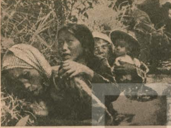
Viet-nam'lı kadınlar, çocuklarıyla birlikte emperyalist saldırganlara karşı savaştılar.

Vietnam Güneydoğu Asya'da dar uzun bir şerit gibi uzanan bir ülkenin adı. Bir zamanlar bağımsız bir ulus iken boyunduruk altına düşmüş Vietnam, önce Fransız, sonra Japon ve nihayet Amerikan emperyalizmine karşı aralıksız savaş vermiştir. Şu günlerde 30 yıldan fazla süren bir savaşın acılarını dindirmek ve bir zamanlar kuzey ve güney şeklinde ayrılan ama şimdi tek bir ülke, tek bir ulus olmanın sevincini tadan bir ülkedir Vietnam.