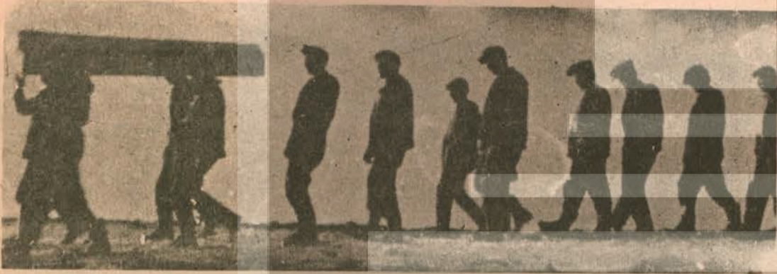
İş Güvenliğinden yoksun Maden İşçileri arasında ölüm kol gezdi. Her yıl yüzlerce kadın dul, yüzlerce çocuk yetim kalır.

Yurdumuzdaki köylerin büyük bir çoğunluğunun durumunu hepimiz biliriz. Eğitimden yoksun olan köy halkı hastasını tedavi için ilaç, hemşire, doktor bulamaz. Yol, Su, Elektrik yoktur.