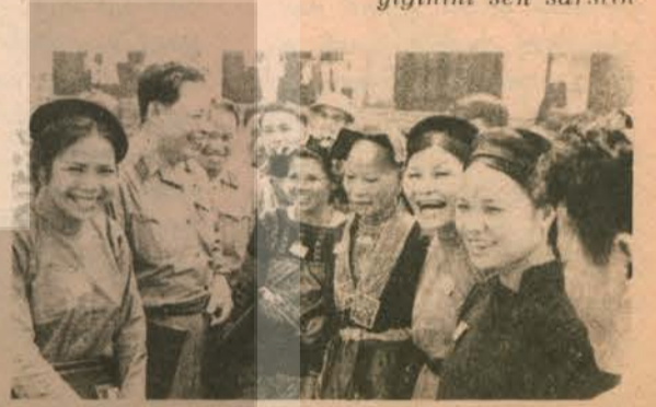
Viet-Nam Kadınlar Birliği üyeleri, kurtuluşun mutluluğu içindedir.

Saldırıda, yüz tabura kumanda ettin. Geceleri, dönüşünde, askerlerin yırtıklarını yamadın. Güneyin kadın Generali, eski kahramanlar soyundan gelen kadın. Beyaz Sarayın çelik ve demir yığımı sen sarstın