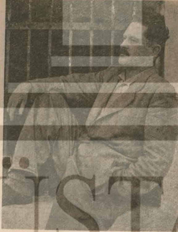
NAZIM HİKMET BURSA CEZAEVİNDE

Toprak gibi sessiz ve üretici, gereğinde taşan ırmak gibi korkunç olan Anadolu kadını; yaratan, cefakâr emekçi kadını şöyle anlatır.