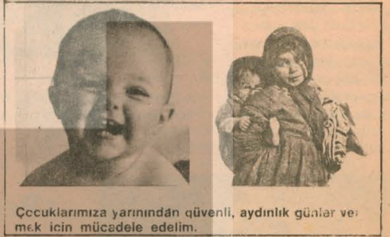
Çocuklarımıza yarından güvenli, aydınlık günler ve mek için mücadele edelim.

«Okul kitaplarında, savaşlara değil barışa övgü dü-